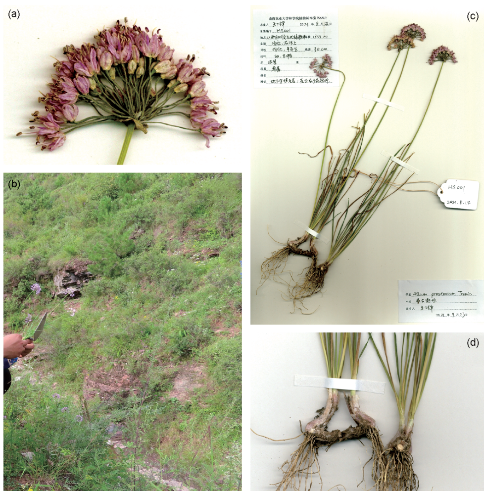
图1 蒙古野韭的形态特征及生境