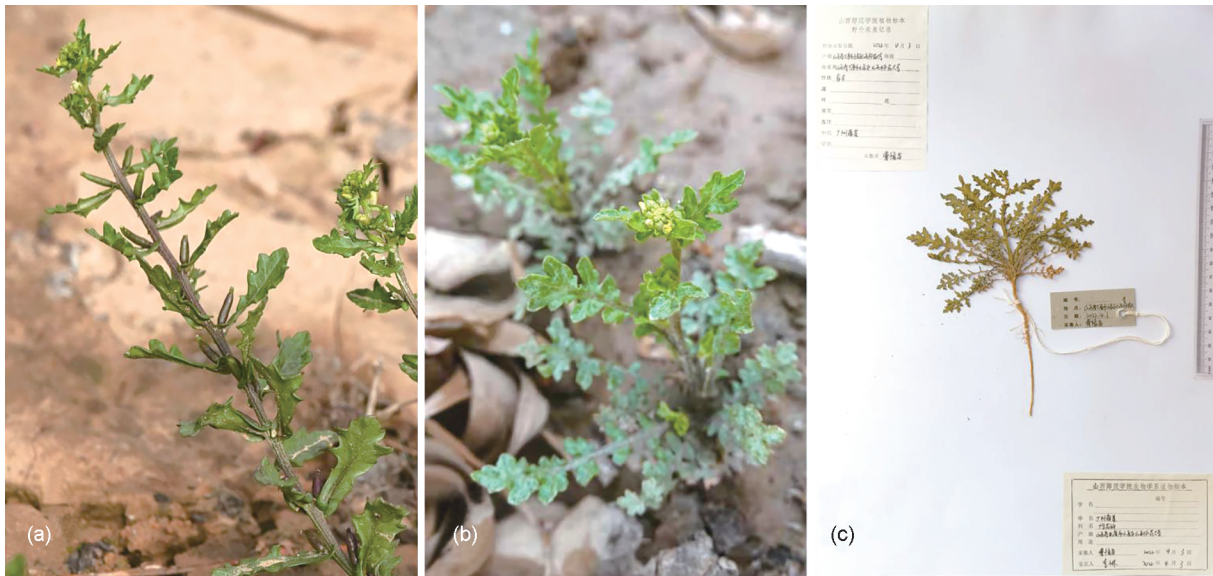
图3 广州蔊菜形态特征 (a)花序;(b)植株;(c)凭证标本