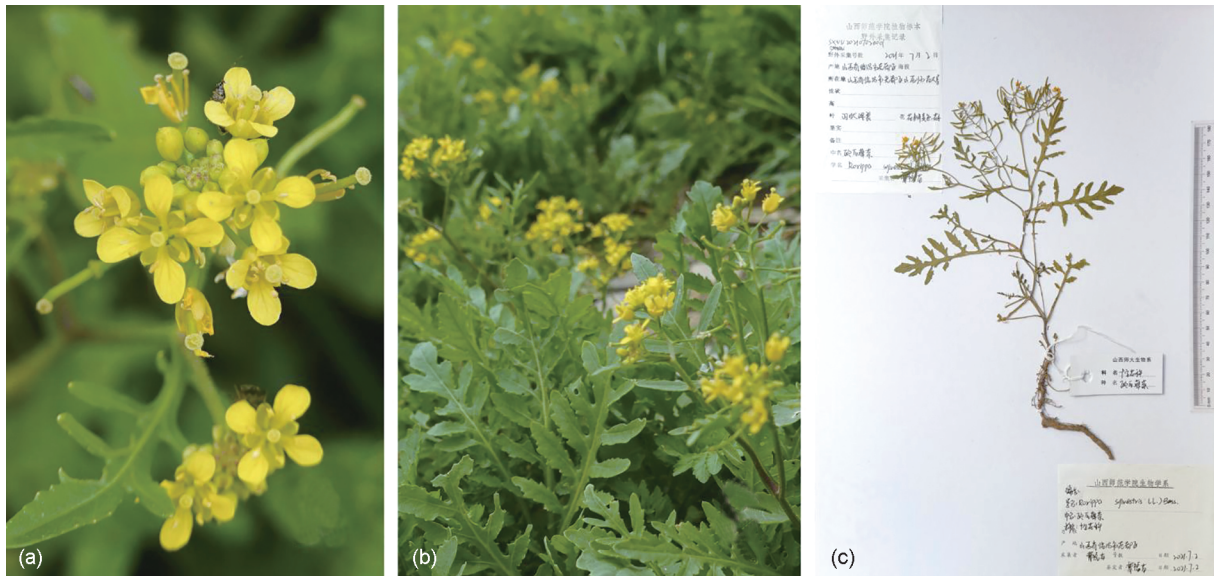
图1 欧亚蔊菜形态特征