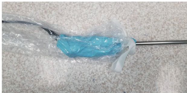
图3 内镜手术防雾导线套

1.2.2.2 全新无菌防雾导线套的使用方法 全新无菌防雾导线套独体设计使外套(主体)牢固固定住副体,使灌洗液无法流入副体,从而防止水雾、雾膜产生和保持无菌。小套(副体)采用高韧性弹力PVC真空薄膜制成,防雾隔绝空气效果良好。全新无菌防雾导线套采用内外叠加重合的双套体设计,从根本上解决和防止了两镜头接触面产生雾膜,见图3。