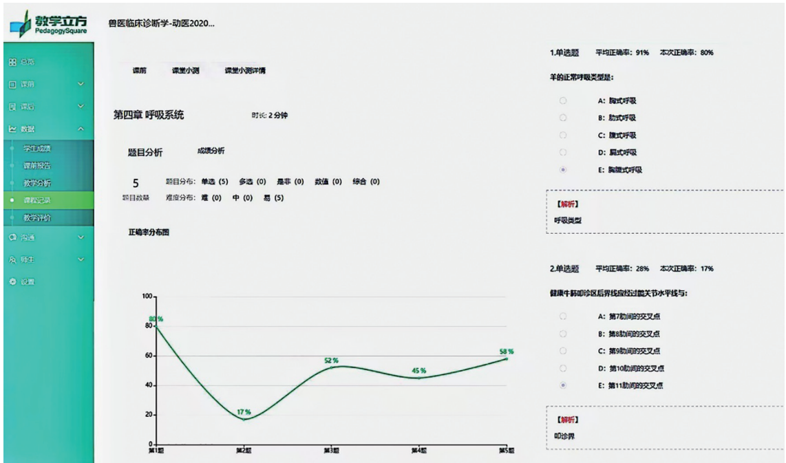
图2 “教学立方”课堂小测数据分析