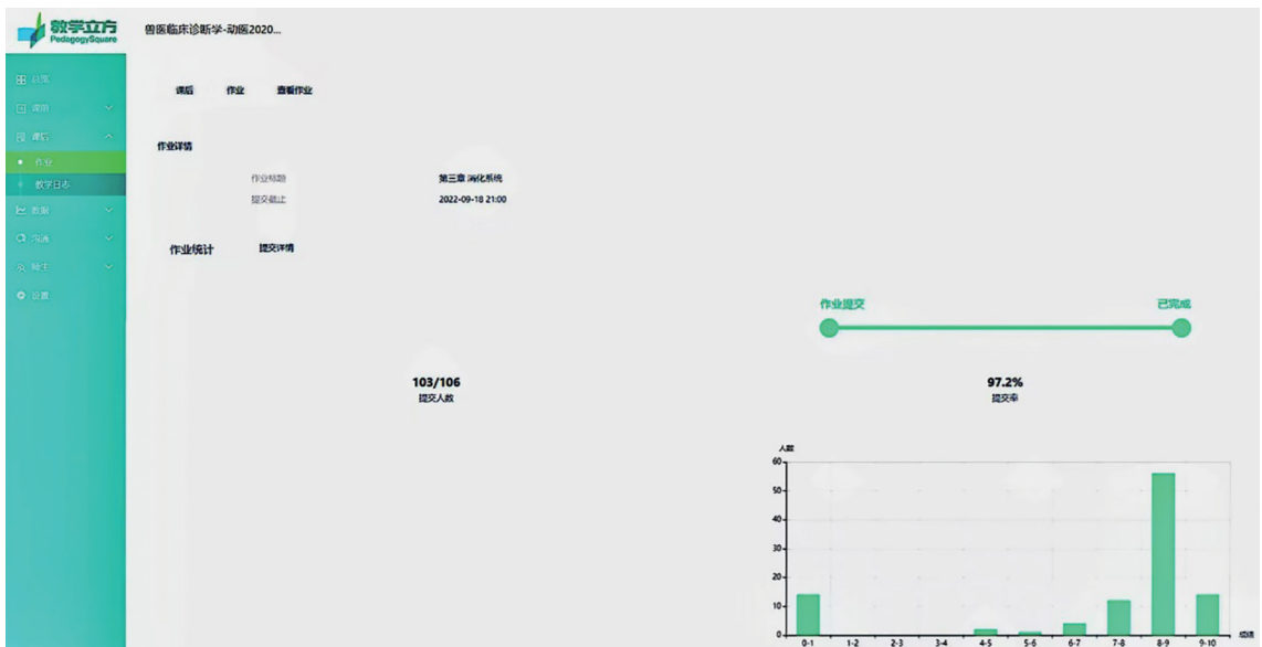
图3 “教学立方”课后数据分析