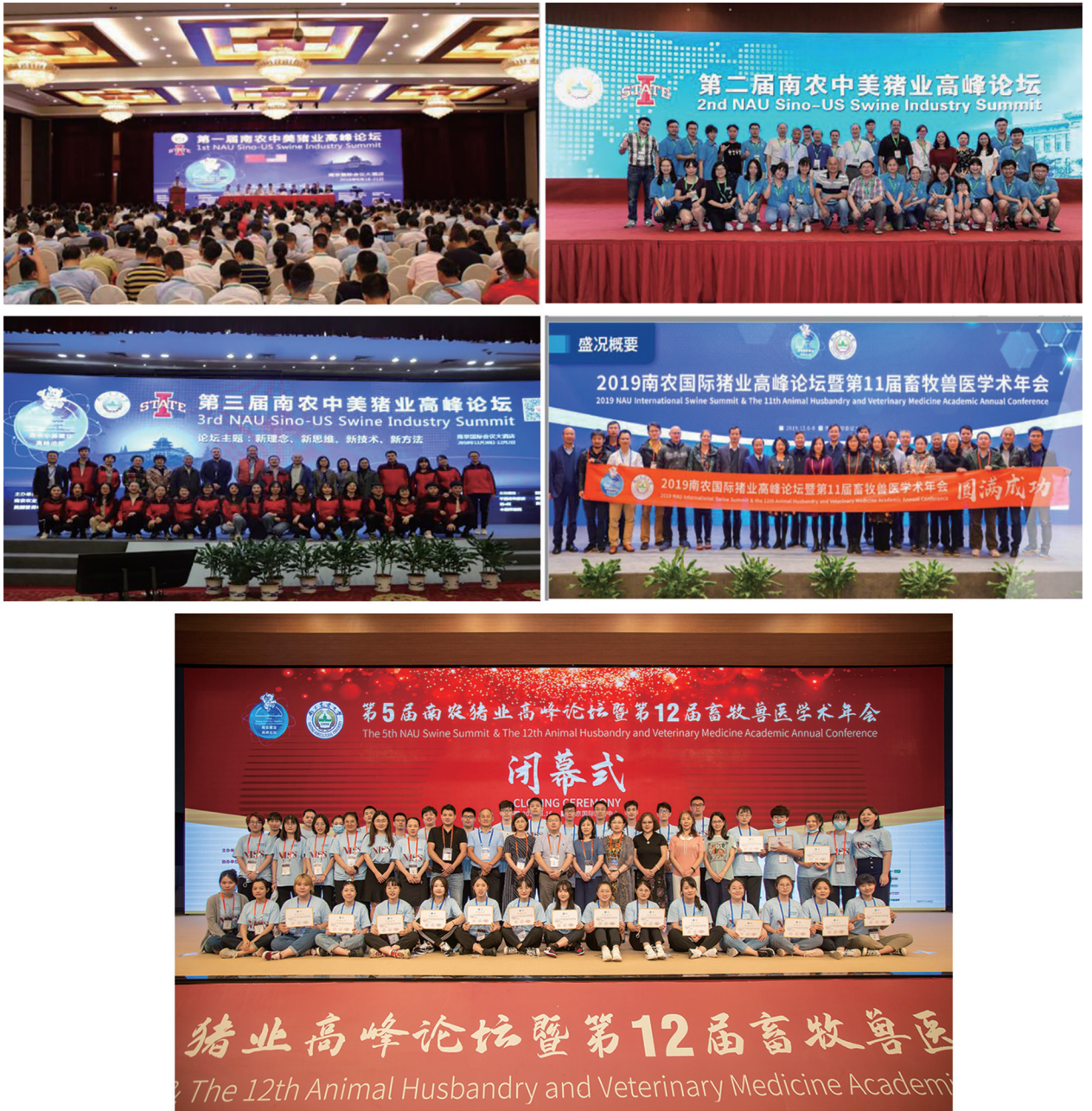
图 21 南农猪业高峰论坛会场场景以及会议主办人员合影