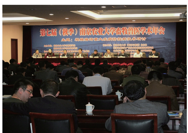
图 20 南京农业大学畜牧兽医学术年会场景