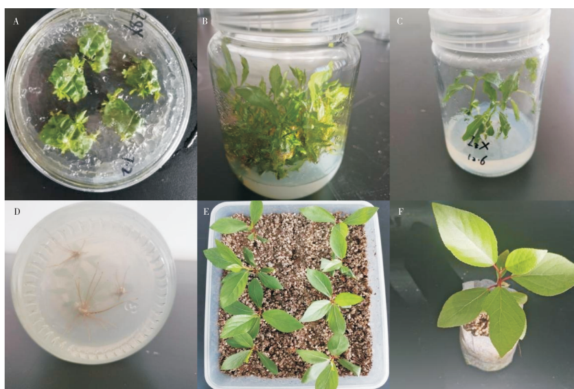
A、B. 新林1号杨开放式不定芽诱导; C、D. 新林1号杨开放式不定芽生根; E、F. 再生植株 A, B. Adventitious bud induction under open condition; C, D. Rooting seedlings under open condition; E, F. transplanted plantlets