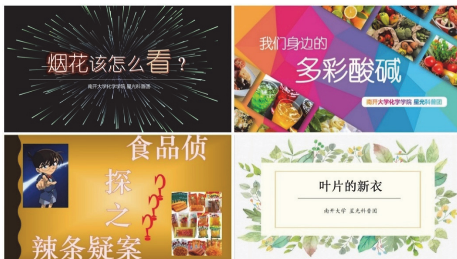
图2 多彩精致的教学PPT

的种种健康隐患，最终完美破解了“辣条疑案”。与此同时，他们也意识到了食品安全在日常生产生活中非凡的重要性，愿意将破解辣条案中所学到的有关知识运用于生活中，关注、分析其他食品的营养价值和食用隐患，接近更安全健康的生活方式。