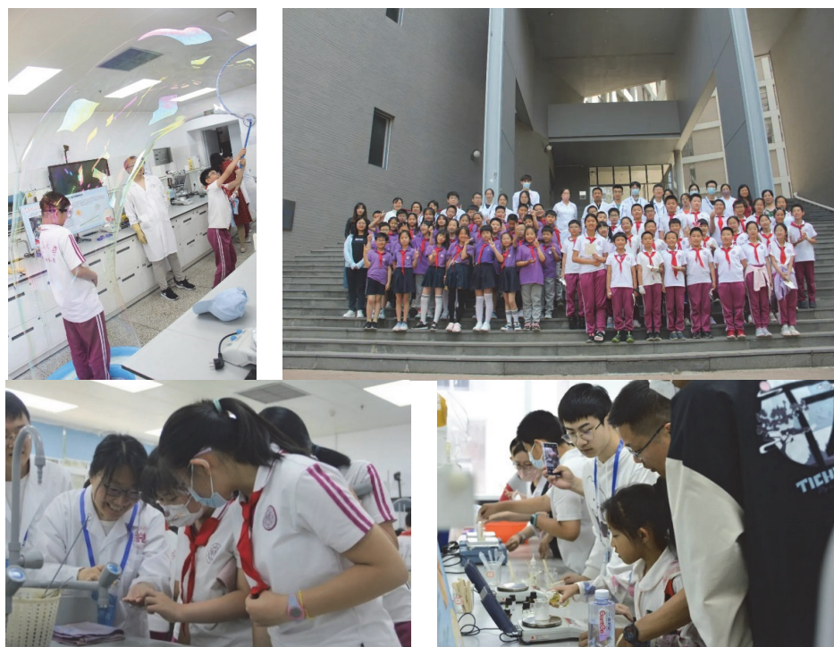
图3 第四届南开大学化学学院科普开放日活动现场

除了送课进校园，科普基地以“请进来”的方式每年举办全国科普开放日、科技周等大型开放活动，邀请学生和家长进入化学实验室。例如2023年5月，南开大学化学科普基地联合农药国家工程研究中心、中心实验室、元素有机化学国家重点实验室多家二级单位，由专业教师和星光科普团的50余人讲师团为观众带来一场别开生面的第四届南开大学化学学院科普开放日活动(见图3)。活动点