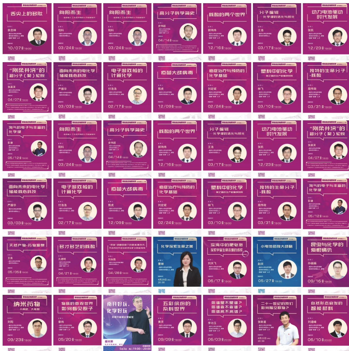
图6 “带你走近物质科学”系列科普讲座部分讲座海报