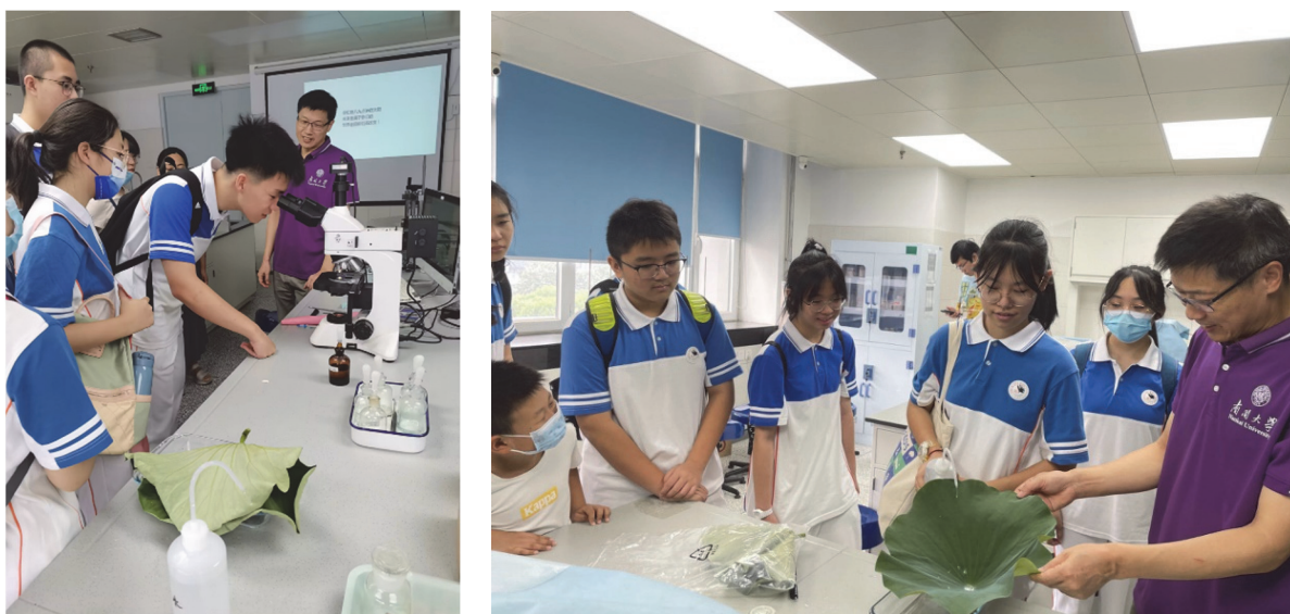
图5 在“显微镜下的探索与创新”实验中中学生探究荷叶效应