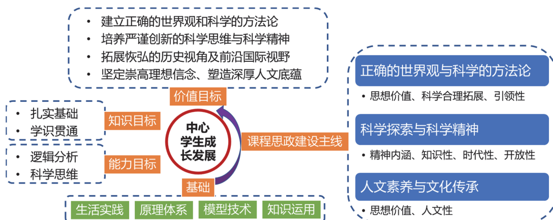
图1 面向非化学专业物理化学课程思政教学体系建设总体思路