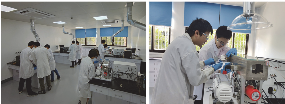
图2 学生2-3人为一组进行实验

(4) 团队实验：实验过程以小组为单位进行(图2)。首先完成主要模块的拆解与组装，并说明进样系统、离子源、质量分析器、检测器、真空系统、控制系统等各模块作用和工作原理。随后利用组装好的模块，完成质谱仪的搭建并进行性能参数调试，直至出现稳定、分辨率较好的质谱峰型，说明各参数及其调节方式对质谱信号分辨率、灵敏度和对分析结果的影响。之后利用自主搭建的质谱仪，对标准样品和未知样品进行测试，并完成谱图解析，得出分析结论。