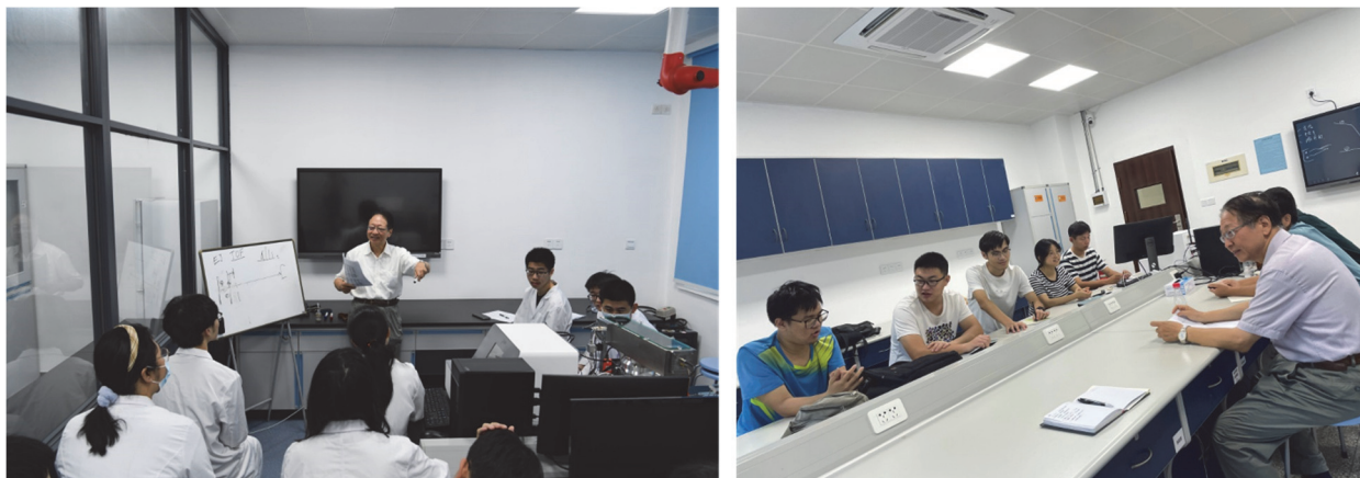
图3 研发团队人员与学生交流

① 讨论：邀请仪器研发团队人员与学生交流(图3)，通过解答学生在搭建仪器过程中产生的疑惑，使学生理清仪器研发的来龙去脉，激发学生原始创新的意识和能力。通过分享在仪器研发过程中遇到的挑战以及解决方法，使学生了解我国科学家在当年经费短缺、科研基础薄弱的条件下如何突破技术瓶颈自主研制质谱仪，并基于这些仪器开展高水平、创新性工作，加深对老一辈科学家高尚意志品质的了解和体会，感受老一辈科学家对青年学生的殷殷期望，增强家国情怀和社会责任。