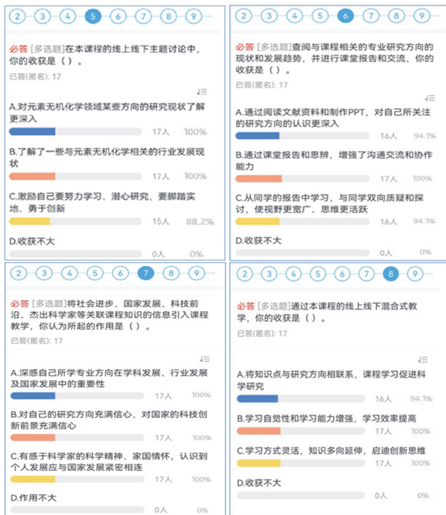
图5 学生对主题讨论、课堂报告、课程思政、个人收获的评价(2023级)