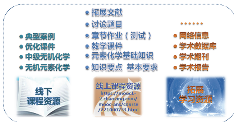
图3 “元素无机化学”多维课程资源图

在“元素无机化学”教学过程中，经授课教师多年探索，不断丰富、积淀、优化和拓展，逐步形成了多维“元素无机化学”课程资源，如图3所示。