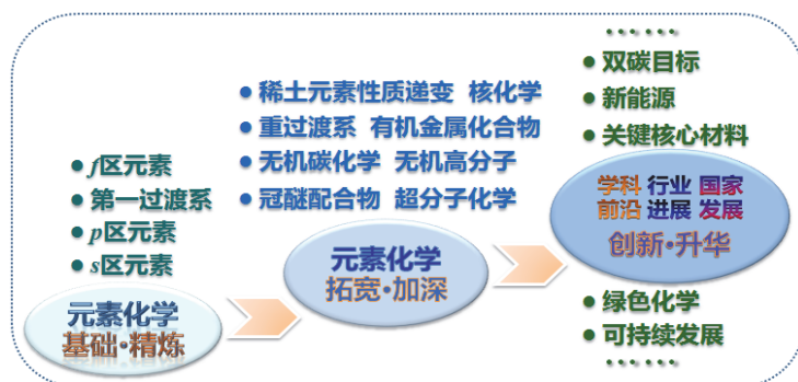
图2 “元素无机化学”课程分层知识体系图

◆ 基础精炼 ：重组《无机元素化学》教材 [5] 中的重要基础知识，精炼s区、p区、第一过渡系及f区元素中的重要单质及化合物的相关知识点，主要面向元素化学知识比较薄弱的跨专业研究生，辅助学生弥补基础元素化学知识。