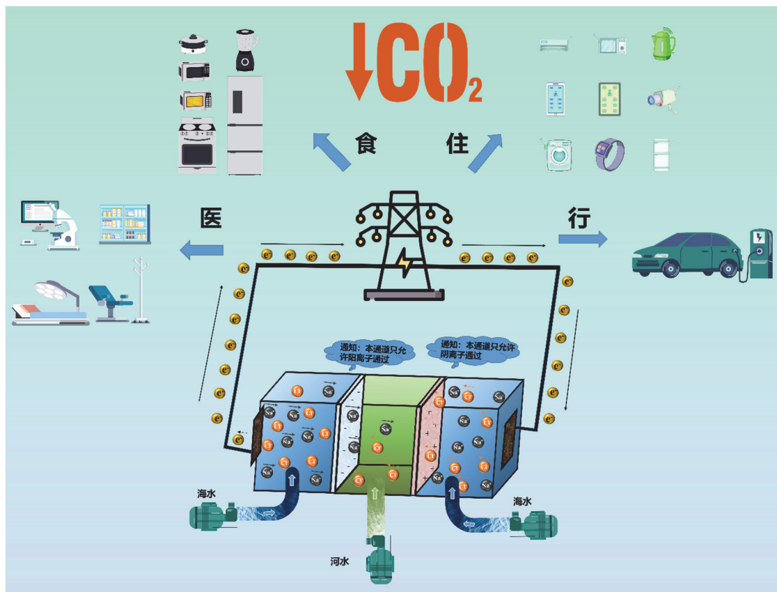
图2 海洋盐差能发电及应用

听到这里，海洋盐差能暗下决心，自己要珍惜工作和学习机会，坚定理想信念，脚踏实地地做好自己的工作，真正把论文写在祖国的大地上！