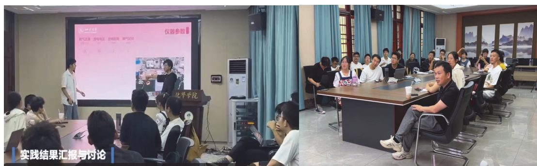
图4 实践结果汇报答辩

课后作业:小型化装置检测水中有毒重金属(如汞、砷、铬)实验报告。完成相应实验操作后收集所得数据,撰写实验报告,最后分组进行实验结果汇报(图4)。老师评判时主要结合学生对水质检测的熟悉程度,对实验报告内容的逻辑性、语言组织能力、问题解决能力、组内协作能力、分组汇报等情况给分。