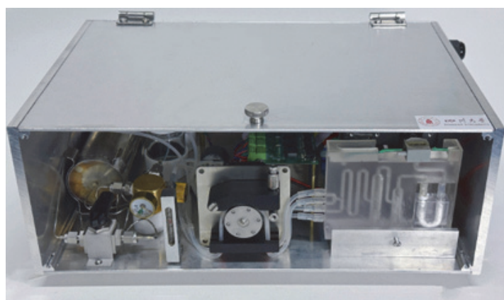
图2 模块化教学微等离子体原子发射光谱仪