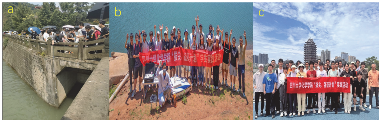
图5 四川大学水质调查实践活动

(a) 都江堰——先哲智慧民族自豪感；(b) 黑龙滩——艰苦奋斗；(c) 眉山湿地公园——绿水青山就是金山银山