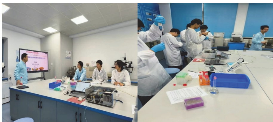
图3 教学光谱仪测定水中有毒重金属

(1) 授课形式：讲授+实践共32学时(图3)。实行小班教学，4组学生，每组学生4-6人。