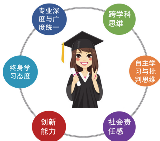
图2 “六位一体”的高层次专业人才