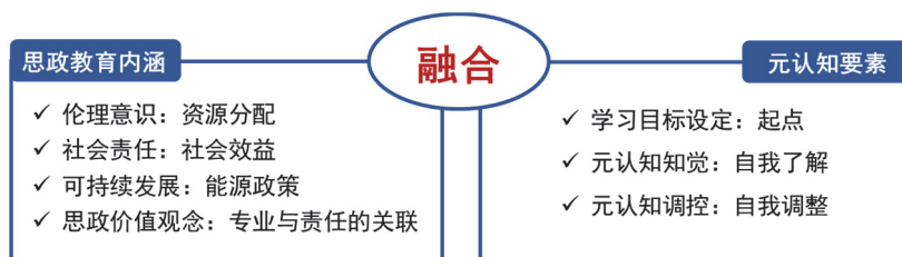
图3 专业课程的思政教育内涵和元认知要素

专业课程的思政教育内涵和元认知要素涉及到学科知识与思想政治理论的有机结合，以及培养学生的元认知能力(图3)，使其在专业学科中不仅具备扎实的专业知识，还能够具备正确的思想政治观念 and 创新能力。