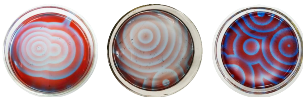
图1 BZ振荡实验中形成的一些同心圆照片

同心圆实验是静态条件下进行的BZ振荡反应，在特定的条件下系统会形成由同心圆构成的颜色鲜艳、层次分明的图案(图1)。同心圆实验中精彩纷呈的现象对提升学生的学习兴趣很有帮助。但是受限于实验时长等因素，各高校开设的BZ振荡实验中较少涉及同心圆实验内容 [1] 。