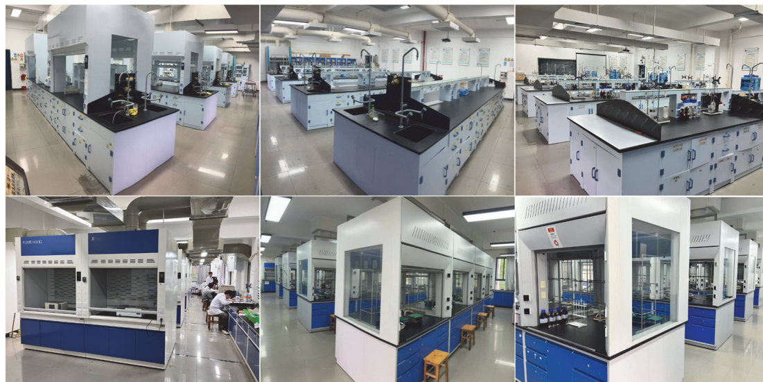
图1 提质改造后的无机化学、分析化学、综合创新、有机化学实验室

实验室均配备危化品台账、废弃物处理台账、化学品安全技术说明书(MSDS)、急救药箱、灭火毯、消防沙箱、喷淋装置等用品, 不断改善实验教学条件与环境。