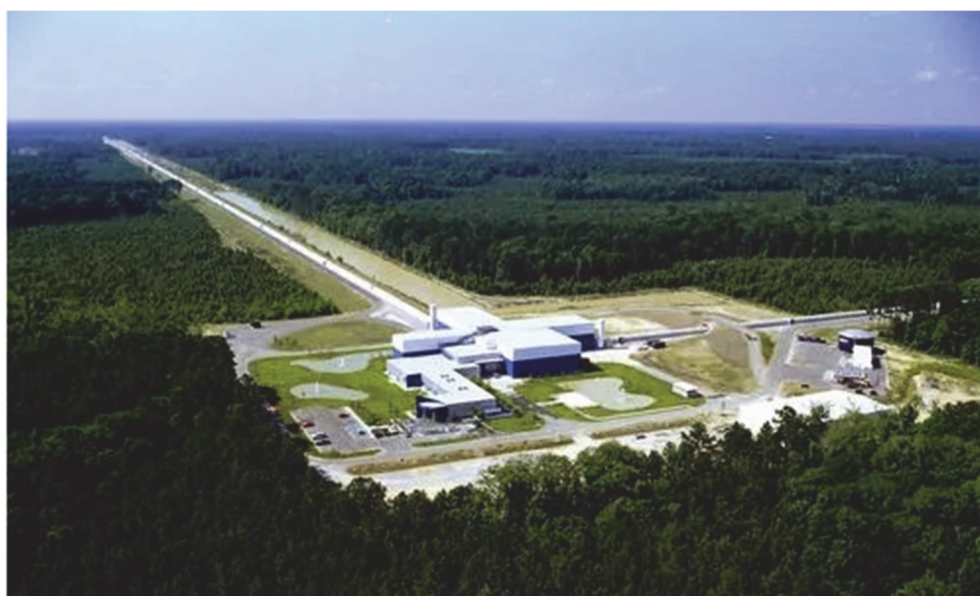
图3 LIGO照片 [10]

以上逐条分析了各类仪器获取相应谱的方式, 从某种意义上说, 这也是通过理解如何获取“时间”而实现统一地理解各类仪器的工作过程。这样的梳理不但有助于学生更深入地理解相应的“谱”, 还能使他们能更好地了解仪器的构造, 对仪器就不再是抽象陌生的, 对仪器的工作运行方式做到“心中有图像”, 从而对仪器的构造、制造产生一定的兴趣。还可以进一步地了解仪器产业的内容以及我们国家仪器产业的现状, 激励他们从事高端仪器的研发和应用, 为国家发展高端化、智能化、绿色化制造业学以致用、贡献一份力量, 彻底改变我国在高端仪器领域薄弱的局面。这里还有许许多多生动的例子, 例如海外留学归来的优秀学子周振带着“做中国人的质谱仪器”的梦想, 于2004年创立广州禾信分析仪器有限公司, 在国家863计划、国家重大科学仪器设备开发专项、国家火炬计划等重点项目支持下, 开展质谱仪器自主开发, 逐步推出在线单颗粒质谱检测系统、在线VOCs (Volatile organic compounds, 挥发物有机物)及恶臭气体质谱监测系统、在线环境污染源在线溯源等质谱仪器, 实现出口美国、德国等历史性突破, 成为“中国制造”的骄傲。这些优秀的科研人员都是响应并践行习总书记“把论文写在祖国大地上”的突出代表。另一方面, 让化学的本科学生了解仪器产业的现状, 也有助于开阔他们的视野、开拓他们的就业渠道。