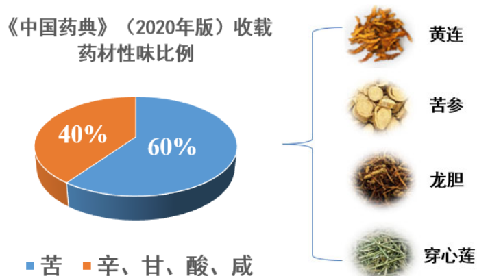
图1 《中国药典》收载药材性味比例

中药的五味药性为辛、甘、酸、苦、咸，就像五支攻打病毒的军团，其中以苦味药性军团最为庞大。《中国药典》(2020年版)所收载的约616种中药材中60%以上具有苦味(见图1)，常见药材如黄连、苦参、龙胆、穿心莲等，其苦味尤其令人印象深刻。