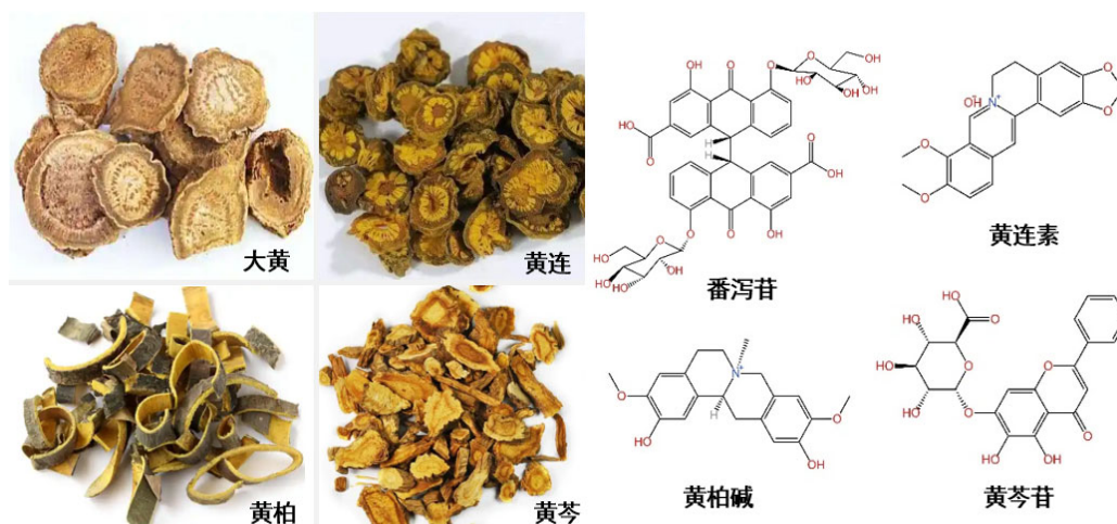
图2 常见苦味中药材及其主要苦味成分

苦味药性军团里的中药材战士多数性寒，寒凉药中苦味的中药占64.8% [1] ，常用于治疗湿热证或者是阴虚火旺的疾病，被称为“清凉战士”，它们大多来源于药用植物的根或茎，虽然味道苦涩，但却有清泄火热、通泄大便、泻火存阴、下气平喘的本领。比如“黄金战士”黄连，它体内的小檗碱就像一把锋利的宝剑，能够斩断体内的“火气”，让你恢复活力；还有“大黄将军”，它体内的番泻苷就像一条“清道夫”，能够帮你清理肠道，让你感觉轻松舒畅 [2] 。常见苦味中药材及其主要苦味成分见图2。