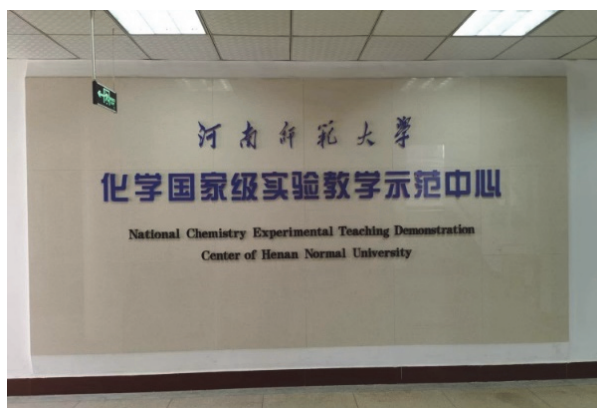
图1 河南师范大学化学国家级实验教学示范中心

被教育部批准为化学国家级实验教学示范中心建设单位，2013年通过教育部评估验收(图1)。