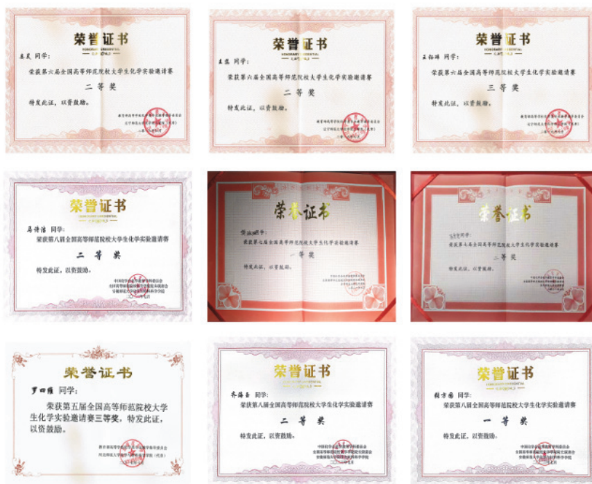
图3 河南师范大学学生化学实验技能大赛部分获奖证书