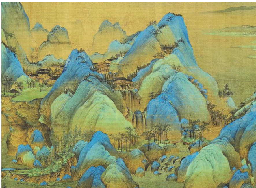
图1 千里江山图(局部)

图是北宋时期绘画天才王希孟在18岁时创作的一副青绿山水绢本设色画。该画作从宏观上展示了我国北宋时期泱泱大国的气势恢宏，从微观上展示出中华民族在绘画工法与技术上的细致入微。咫尺千里，五色备焉，为什么跨越九百余年，《千里江山图》依旧能历久弥新，绚丽多彩？接下来，我们将从化学的角度来解开这个谜题。