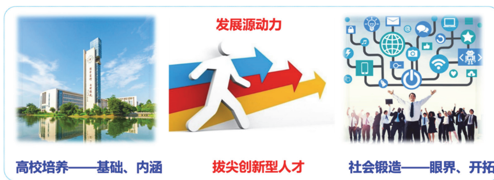
图1 高校是拔尖创新型人才基础和内涵培养的第一阵地

高校是拔尖创新型人才基础和内涵培养的第一阵地(图1), 高校教师科研成果的转化途径除了技术转让、产学研合作等服务国家、地方经济建设方式以外, 高水平科研成果向教学资源的有效转化被视为“科技——教育——人才培养”相融合的最有效路径和模式, 把课本以外的“超纲知识”打造为学生认识科技前沿的钥匙和创新源动力, 真正做到科教融汇, 科研育人。