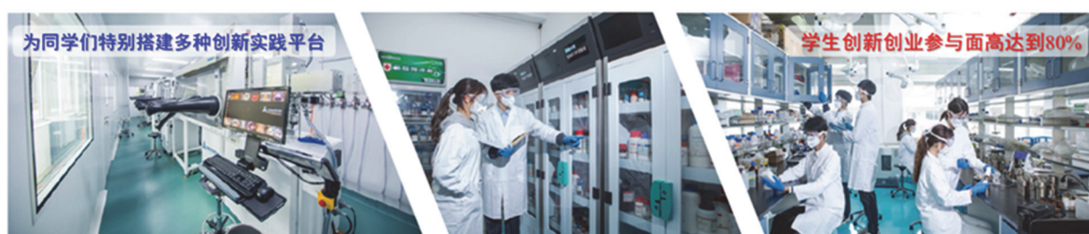
图6 拔尖创新人才培养创新实践平台搭建

高水平实践平台搭建奠定了创新实践基础。中心各科研团队场地资源丰富,实验设施齐全,除了配备数十种常规大型科研仪器设备如核磁共振波谱仪(NMR)、电子显微镜(扫描SEM、透射TEM、场发射FEM)、X光射线衍射仪(XRD)、红外光谱(FTIR)、拉曼光谱及显微成像、原子力及扫描隧道显微镜(AFM & STM)、荧光共聚焦显微镜之外,还设计了具备不同模块化功能的仪器设备实验平台,包括电化学传感基础及应用、电化学传感基础及应用、电化学能源及催化材料、柔性传感器件工程、光电材料及传感器件,以及分析仪器化设计工程等多个类别,为同学们充分认识自然,探索自然和引领创新事业发展奠定了良好的基础,先进创新实践平台的搭建为拔尖创新人才培养提供了坚实而强有力的基础条件支撑(图6)。