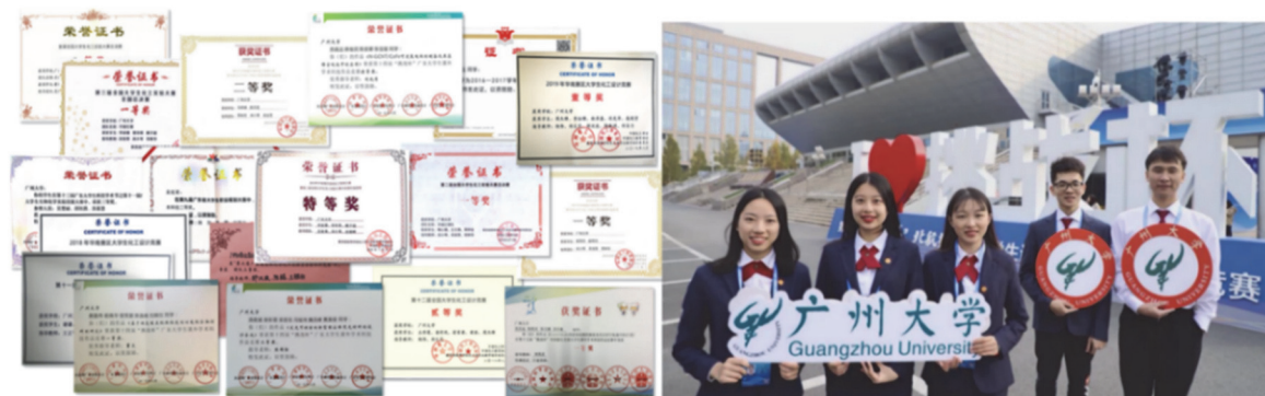
图7 实践教学成果及创新创业大赛获奖

中心注重对学生学科特长和创新潜质的培养和锻炼,着力打造科学基础和动手能力兼备、知行合一的创新型人才,具体可通过创新实践活动体现出来。如中心在本科生中实施以学生实验大赛带动学生专业素质全面提升的“凌云工程”,充分利用国家实验教学示范中心资源,积极组织学生参加实践教学成果及创新创业大赛,如“互联网+”创业大赛、化工设计大赛、实验室安全竞赛、实验技能大赛、师范技能大赛等学科竞赛,以赛促学,使学生在实践创新能力方面实现飞跃发展(图7)。