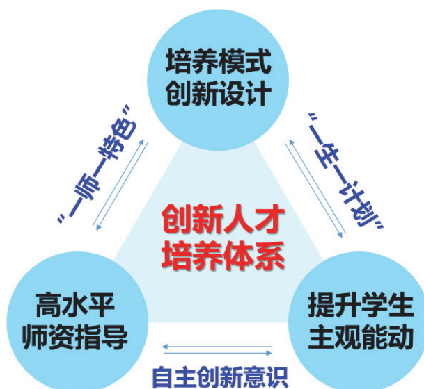
图5 化学学科拔尖创新人才培养体系构建示例

结合化学学科生师比较低的具体情况着力打造“一生一计划”的创新人才培养策略，鼓励本科生尽早加入教师科研团队参与科学实践研究，为每位学生量身打造其感兴趣的研究课题并制定未来发展规划。跟踪世界前沿、引领科技创新、结合国家地方需求的科技实践指导极大提升学生勇攀学术高峰的志趣，同时科研团队优越的实验条件给予学生足够的硬件条件支撑，研本联动梯队式传帮带模式让学生更好、更快融入实践进程，真正实现从“要我学”到“我要学”的转变，从而不断提升创新实践的主观能动性。