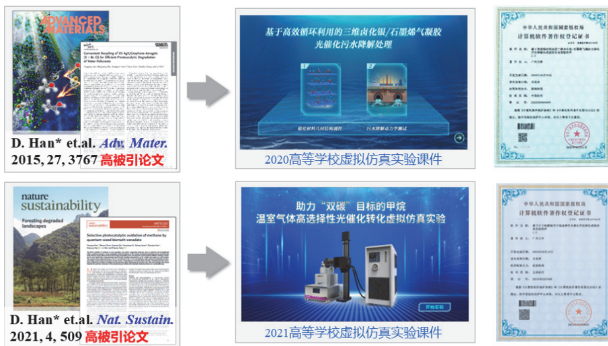
图3 高水平科研论文转化为虚拟仿真教学资源

院的人才培养、学科建设等工作的推进 [1] , 以上两门课程的最大特点在于有效地规避了实体的高危操作, 学生可通过电脑操作步骤试错以保障实验安全。作为一种“可逆”的试错方式, 虚拟现实中的不规范操作在带给学生浸润式视觉震撼的同时, 又能够充分展现可能带来的严重后果, 警示类似错误不可再犯。另外虚拟实验步骤的设计有效地缩短了实验周期, 极大降低了时间和经济成本。由于以上两个实验所涉及实验内容的专业性, 如果直接面向本科生开放存在较大的实际困难, 虚拟元素的融入可使课程跨越实践难度难点, 有效解决以上难题。利用虚拟交互模式还可以实现化学过程平行时空的有效转换, 通过实验条件的改变探索不同产物路径, 有助于学生在不断的探究模式中掌握并充分理解整个实验过程, 培养学生解决复杂问题的综合能力。