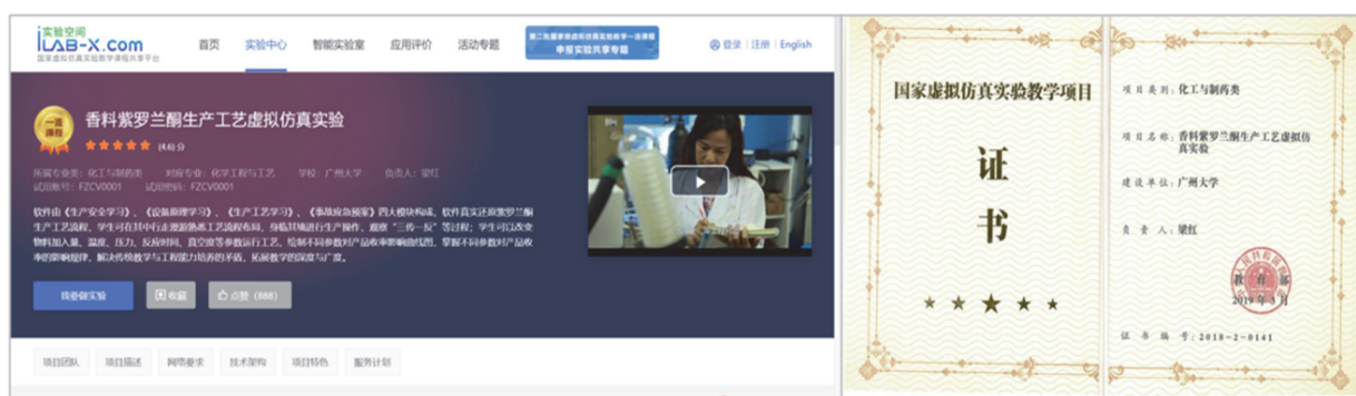
图2 国家级虚拟仿真实验教学项目

虚实结合的创新实验教学体系设计能够有效提升实践创新的普适性。相对于常规实验课程, 虚拟仿真元素的有效融入能够使创新实践教学活起来、动起来、靓起来, 同时实现了创新实践教学的全人皆学、处处能学、时时可学的目的。如基于中心教师梁红教授牵头开发具有自主知识产权的“香料紫罗兰酮生产工艺虚拟仿真实验”在国家虚拟仿真平台开放, 虚拟实验教学中积极引入人工智能技术应用, 构建理论与实践高度融合的“现代企业情景式”教学环境, 拓展教学深度和广度, 解决传统教学与工程能力培养的矛盾, 获得了广东省教育研究项目的资助。该课程被认定为首批国家级一流本科课程、国家虚拟仿真实验项目, 课件获2019年广东省教育“双融双创”教师教育教学信息化交流及新媒体新技术教学应用三等奖、2019年广州市教育教学信息化创新应用——高教组二等奖和2022年广州市教育教学信息化教学案例一等奖(图2)。