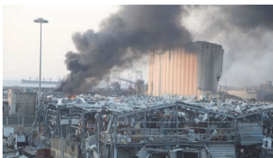
图2 黎巴嫩贝鲁特港爆炸事故 [10]

爆炸部落中已知最具爆炸性的物质之一是六硝基六氮杂异伍兹烷(CL-20)家族 [9] , 还有我们熟知的炸药三硝基甲苯(TNT)、四硝基甲苯(DNT)等, 不少事故都是出自他们之手。爆炸部落的首领是硝酸铵(NH 4 NO 3 ), 淇淇顿时想起他在外界的传闻, 几年前, 爆炸部落的“硝酸铵”不甘蜗居在又小又窄、通风不佳的住所, 一把火烧了房子, 顿时漫天升起红色烟雾, 周围的居民也未幸免于难, 发生巨大火灾, 房屋受损严重。如图2所示为硝酸铵引发的黎巴嫩贝鲁特港爆炸事故。