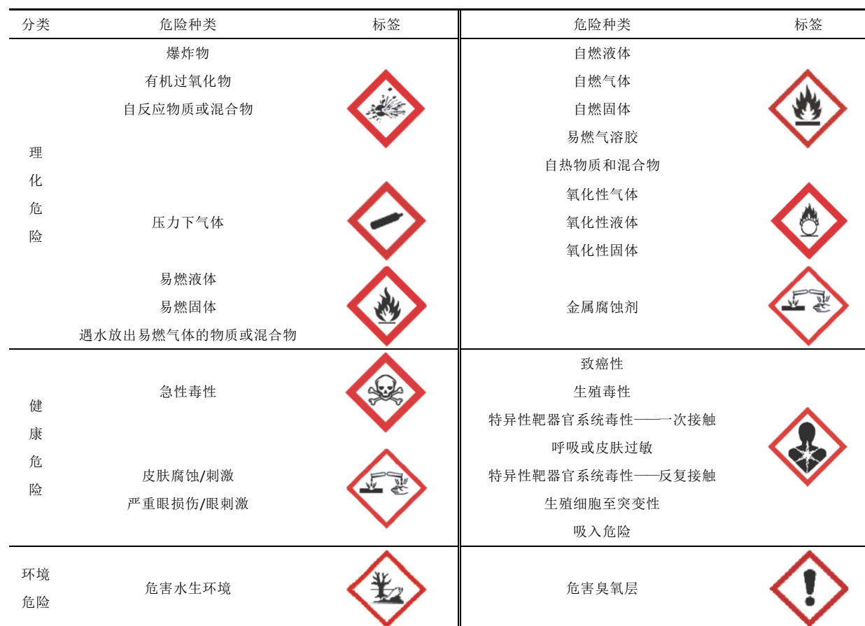
表1 GB 13690-2009中危险化学品分类

存储要求严格, 存在许多安全隐患, 因此在使用时必须格外小心。那么经常和实验室打交道的我们, 该如何避免危险事故的发生呢? 首先, 我们需要充分了解危险化学品, 我国的危险化学品分类GB 13690-2009中将化学品危险性分为3大类, 28小类。分类及标志如表1 [3] 所示。通过该标准快速识别化学品的危险性, 同时指导从业者正确地使用和存储危险化学品。一旦看到这些标志就应引起警惕。其次, 正确的使用和储存危险化学品也至关重要。