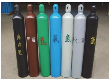
图1 实验室常见气瓶样式 [8]

这些气体所居住的钢瓶都是密不透风的(如图1), 首领需要定期检查钢瓶是否有损伤或者泄漏的情况, 像氩家族这种装有惰性气体的钢瓶, 需要每五年检查一次, 而一般的气体钢瓶只需要三年检查一次即可。