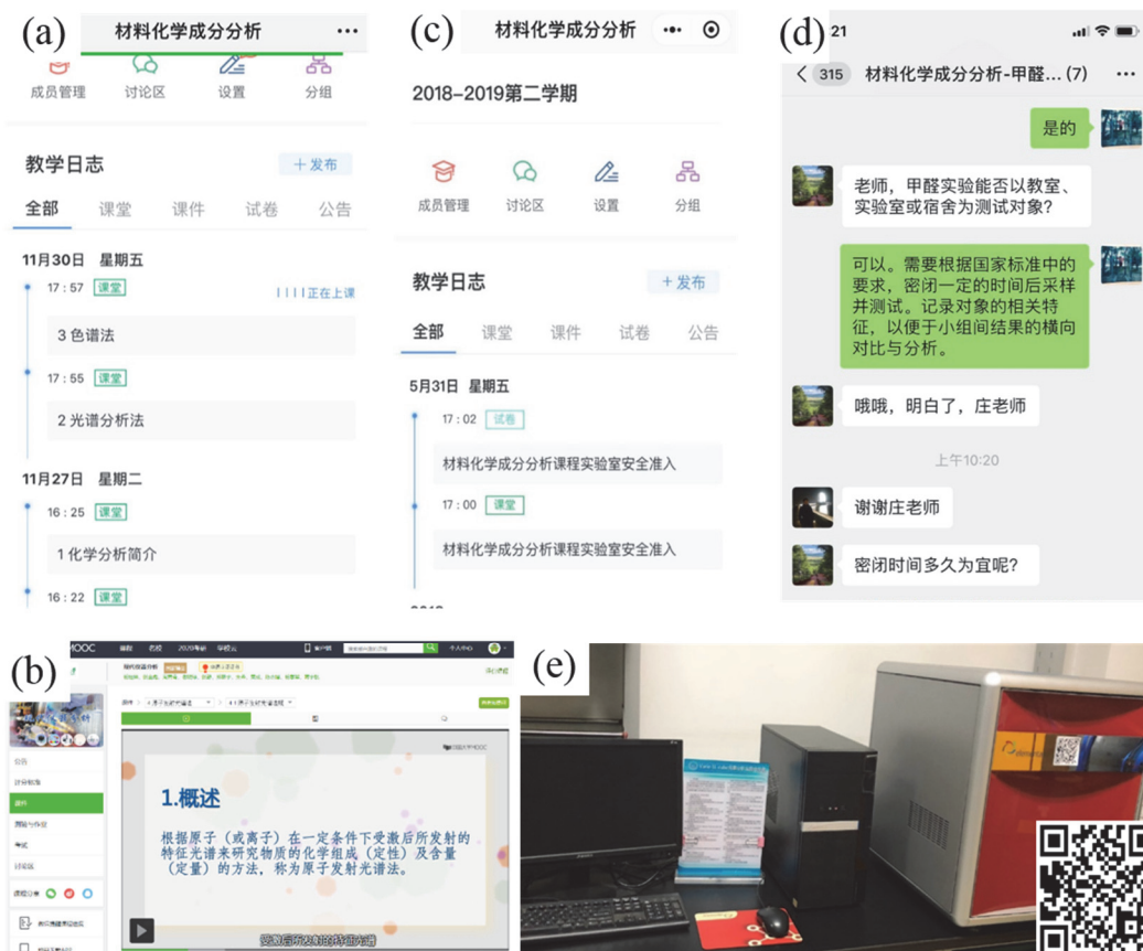
图3 课程线上教学方案：(a) “雨课堂”智慧教学工具教师手机端界面，(b) 通过慕课平台线上学习，(c) 实验室安全准入线上答题，(d) 通过微信开展线上小组讨论，(e) 大型仪器(元素分析仪)及二维码信息