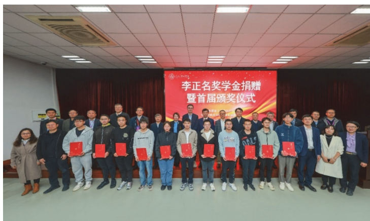
图3 李正名奖学金捐赠暨首届颁奖仪式

李正名院士因病不幸于2021年10月逝世，享年90岁。弥留之际他始终心系南开大学的发展建设，心系勇攀科学高峰而忘我科研的学生。根据遗愿，其家属代表李先生捐资在南开大学设立“李正名奖学金”，奖励南开大学化学学院有机化学和农药学专业的优秀研究生，肯定他们在学业上的卓越成就和不懈努力，支持他们未来学术道路，鼓励健康全面发展。该捐赠仪式于2024年10月19日举行，参加活动的有南开大学校领导，中国科学院院士周其林、中国工程院院士钱旭红、中国工程院院士宋宝安以及李正名家属等近200名师生，同时为首届获奖学生颁发了奖学金(图3)。