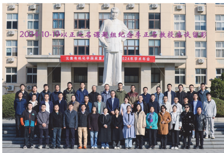
图4 李正名课题组部分毕业生合影

研究所(下称元素所)培养的学生十分关心,在2012年元素所建立50周年之际,他特地组织相关人员费时费力整理了元素所历年培养的428名博士生名录和1064名硕士生名录,为后人留下了极其珍贵的资料 [6] 。自2007年起,南开大学设立良师益友奖,李正名院士分别于2009和2013年获得这项殊荣,并数次获得提名,表明他在南开大学广大师生当中具有极高的人气。李正名先生非常关心大学生的健康成长,尤其注重以身作则,开展爱国主义教育。在2021年6月,他为新生写了一封公开信,里边提到“……旭日东升的你们,作为祖国未来的建设者和接班人,必将担负起伟大时代所赋予的神圣使命,真正做到小我融入大我,为祖国的繁荣昌盛交出一份使广大人民满意的答卷……”。这些事情,充分反映了李正名先生崇高的教育家精神。