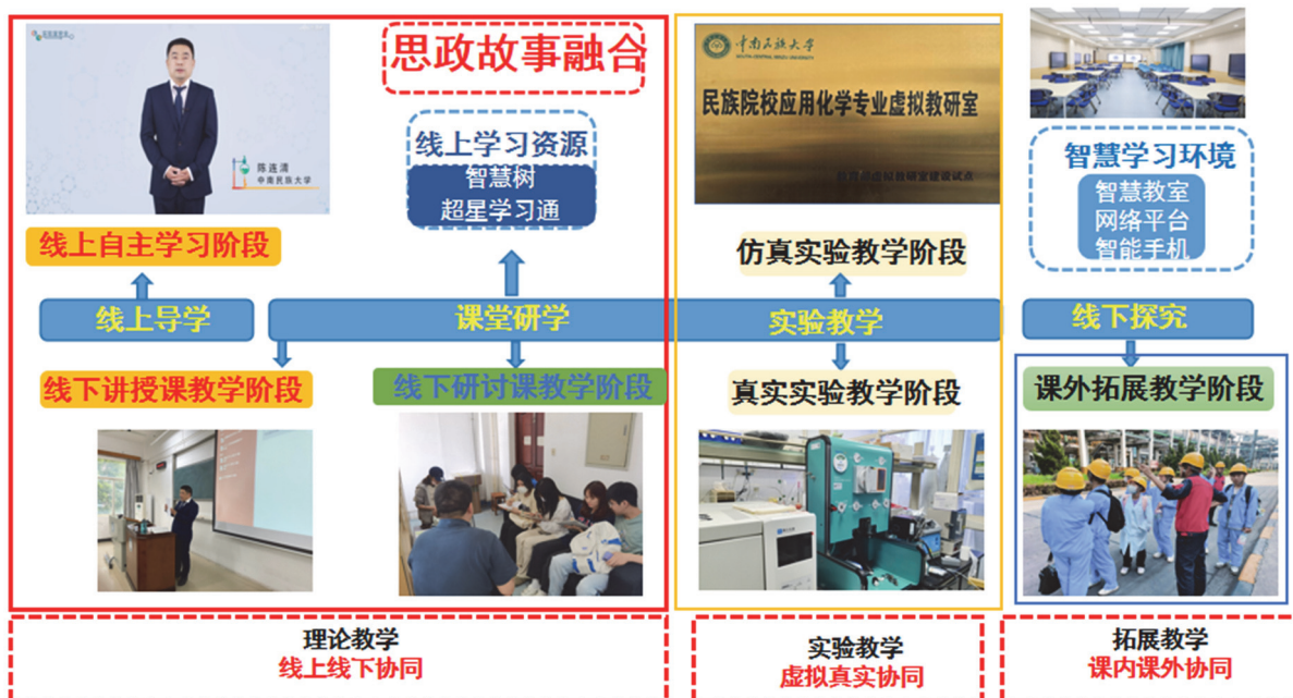
图3 混合式教学法设计