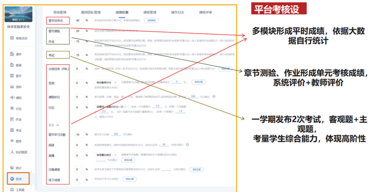
图5 侧重形成性评价

成绩评定以形成性评价和终结性评价相结合(图5), 着眼于科学全面地评价学生综合素质, 推动学生自主学习, 达到以评促学的目的, 实现全过程考核有机融合 [9] , 全面有效地提升学习效果。同时, 利用学习通进行问卷调查, 实时获得学生的反馈信息, 及时进行教学反思, 优化教学设计, 促使反馈改进常态化, 让学生、教师、课程共同成长、共同发展!