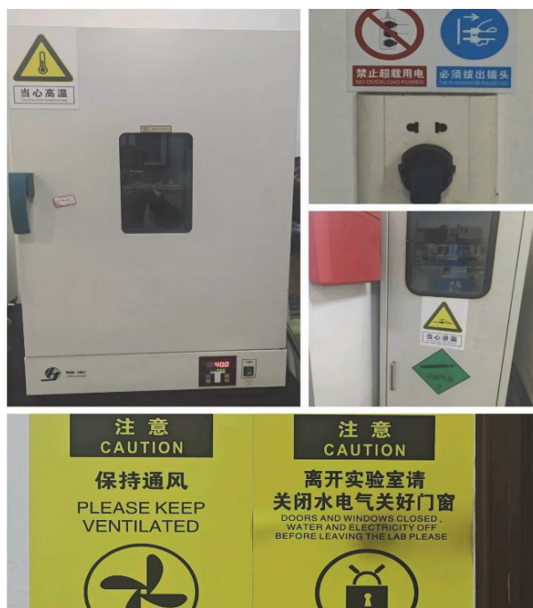
图2 实验室安全警示语

构建显性与隐性教育相结合的课程思政内容体系 [4] 。在显性教育环节，设置实验安全专题讲座、新闻案例分析、社会实践等内容，明确告诉学生在化学实验室中哪些行为是安全的，哪些是危险的，以及如何正确处理意外情况。在教学过程中通过案例分析，引入相关的法律法规，如《中华人民共和国安全生产法》《危险化学品安全管理条例》等，让学生了解法律法规在实验室安全管理中的重要性，组织学生就案例中的具体问题进行小组讨论，引导学生运用社会主义核心价值观来分析和解决问题。在隐性教育中，通过实验室环境布置、宣传栏、警示标志以及实验室安全警示语(图2)等，营造一种安全、合规的实验室文化氛围。同时教师通过自己的行为为学生树立榜样，严格遵守实验室安全规程，展现良好的职业操守，在教学中融入爱国、创新、诚信、友善等社会主义核心价值观的元素，让学生在日常实验中不断地接受隐性教育。以化学实验室安全与环境保护为例，在课程中详细讲解化学实验室安全操作规程、个人防护装备的正确使用、化学品的妥善存放与处理等内容，进行显性教育。明确介绍《环境保护法》《固体废物污染环境防治法》等相关法律法规，强调遵守法律的重要性。隐性教育环节，通过实验室废物的分类存放和处理，让学生在实践中体验到绿色环保的重要性，培养他们节约资源和保护环境意识。