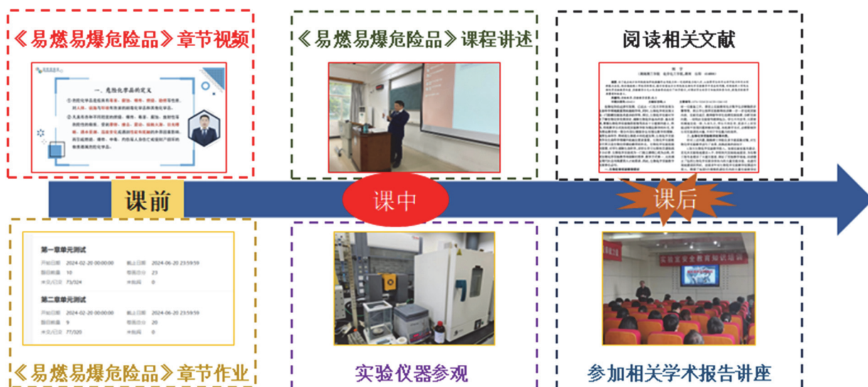
图4 案例分析法及课前、课中和课后实施说明