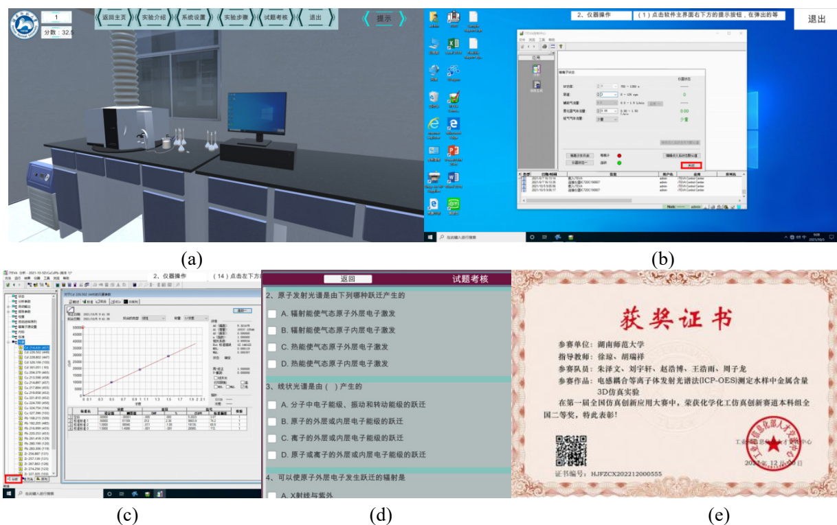
图4 ICP-OES实验3D虚拟仿真场景图

虚拟仿真作品“电感耦合等离子体发射光谱法(ICP-OES)测定水样中金属含量3D仿真实验”进行虚拟仿真教学。该虚拟仿真作品由本课题组指导下的2020级五名本科生自主完成,并荣获2022年第一届全国仿真创新应用大赛化学化工仿真创新赛道本科组全国二等奖,同时完成了软件著作权的申报与登记(图4)。学生首先在虚拟仿真实验平台上进行学习,深入理解ICP-OES的各个组成部分及其功能,学习与训练内容包括样品的准备、仪器的设置、操作流程及数据处理等多方面。通过这种人机交互式的训练方式,学生能够更加直观而深刻地掌握ICP-OES的工作流程和技术要点。