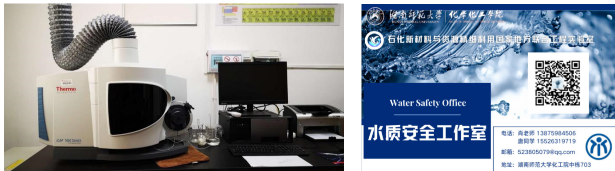
图5 ICP-OES实验室实景图(左)和实验室牌匾图(右)

2022)》进行对比,以评估饮用水中金属元素含量是否超出安全范围,并据此完成实验报告,研究结果将为家乡相关部门提供科学决策依据,及时发现并解决潜在的水质问题,共同维护公共水域安全。