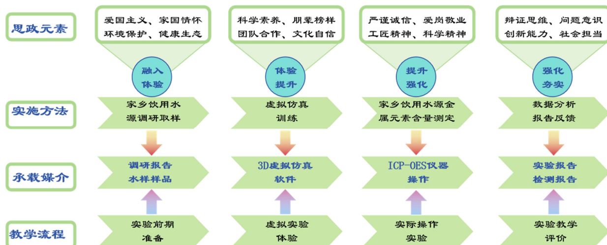
图3 “自主设计+虚实结合”模式下“ICP-OES测定家乡饮用水源金属元素含量”实验课程思政融合教学流程图

该实验通过开放式的实验设计, 将学生实验兴趣点与实验的开放式特色高度契合。在“自主设计”环节中融入“社会责任感提升”等思政核心要素; 在“虚实结合”环节中切入“朋辈榜样”等思政元素, 有效促进了“榜样力量”思政要素在实验过程中的定位融合; 在“实际操作实验”环节中强化“严谨诚信”等科学精神的体验与提升; 在“实验教学评价”环节中夯实了学生发现问题、解决问题的辩证思维方法和社会责任担当。从而多位点地实现了课程思政元素在实验各环节深度融合, 增强了潜移默化的思政教育长效机制, 确定了专业知识教育和课程思政教育切实可行的深度契合方法, 明确了课程思政元素的承载媒介及具体交互载体 [21,22] 。因而, 有利于促进学生的知识掌握、能力提升、素质培养等多维度课程目标的达成。