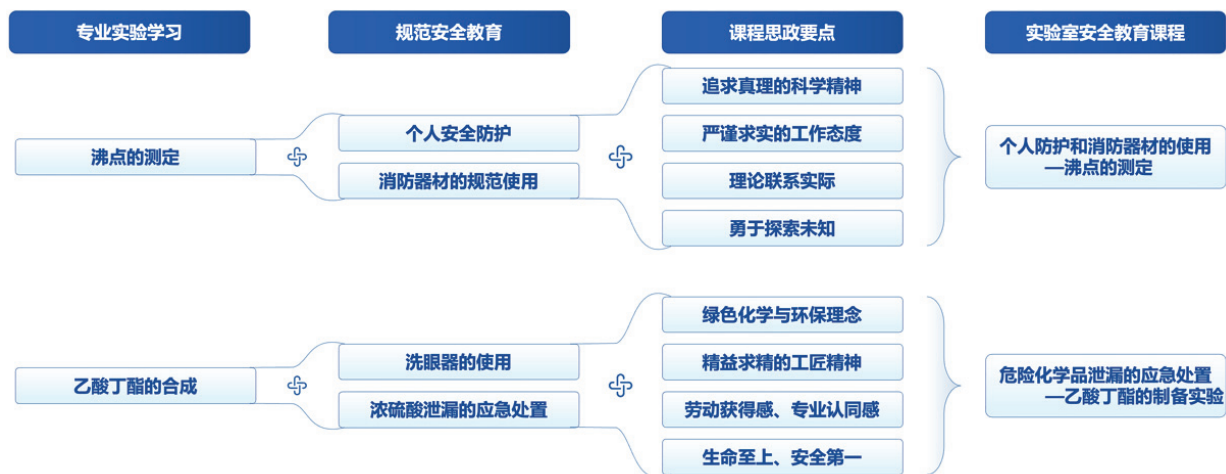
图2 实验室安全教育课程部分教学内容融合示意图

教育课程在“有机化学实验”常用的讲授法和演示法的基础上，引入案例教学法、问题驱动法、小组合作法、情景模拟法等多种授课方法，持续激发学生在学习热情，培养学生发现问题、分析问题和解决问题的能力，从而在教学效果上显著提升师生的满意度。例如在“乙酸丁酯的制备”实验课程中，针对实验中所用存在较高安全隐患的浓硫酸，教师在讲解实验过程中利用多种教学方法自然而然地展开“浓硫酸泄漏的应急处置”内容，首先采用案例教学法引出浓硫酸泄漏事件的严重性和危害性，提高学生警觉性；然后采用问题驱动法让学生思考如何正确使用浓硫酸以及应对浓硫酸的泄漏，期间适当穿插互动提问和讲解答疑；最后采用小组合作法让学生共同完成浓硫酸泄漏的应急处置。