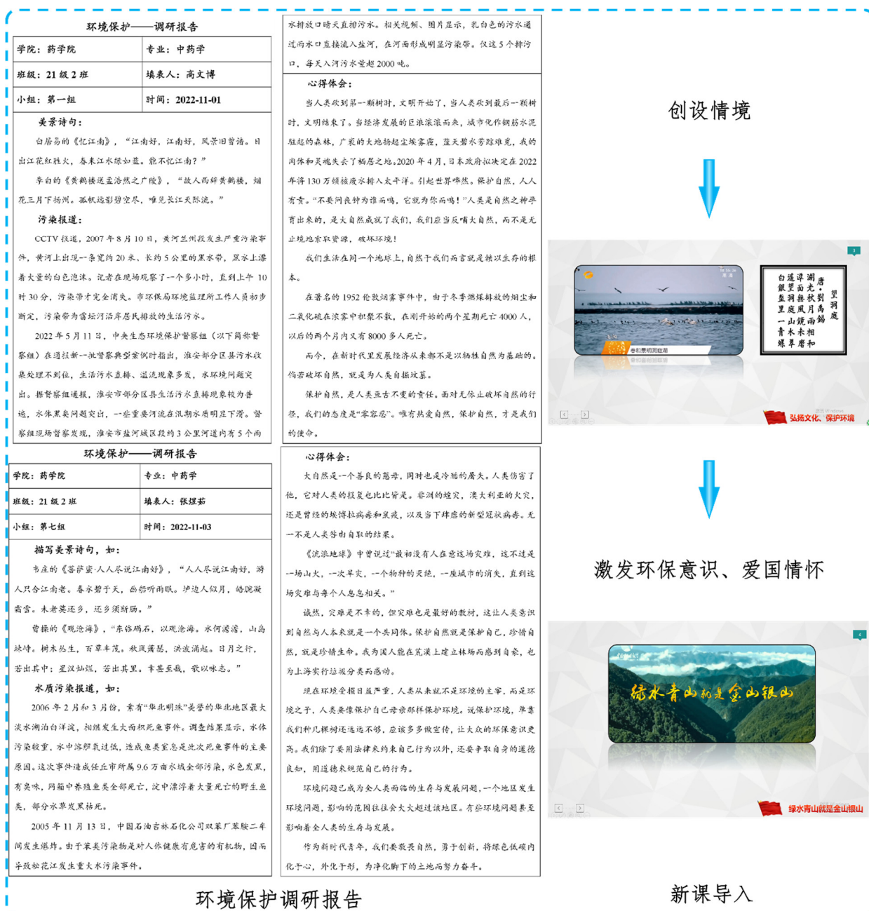
图2 课前环境调研报告及课程导入

(5) 要点总结。教师按照知识要点特性，从原理、滴定条件、指示剂选择等方面对比三种氧化还原滴定法，让学生能够形成知识脉络主线。学生课后需提交本章节的思维导图，利用思维导图呈现概念之间的层次关系和思维逻辑顺序，帮助学生进行信息的储存和提取，提高教学质量和学习效率。