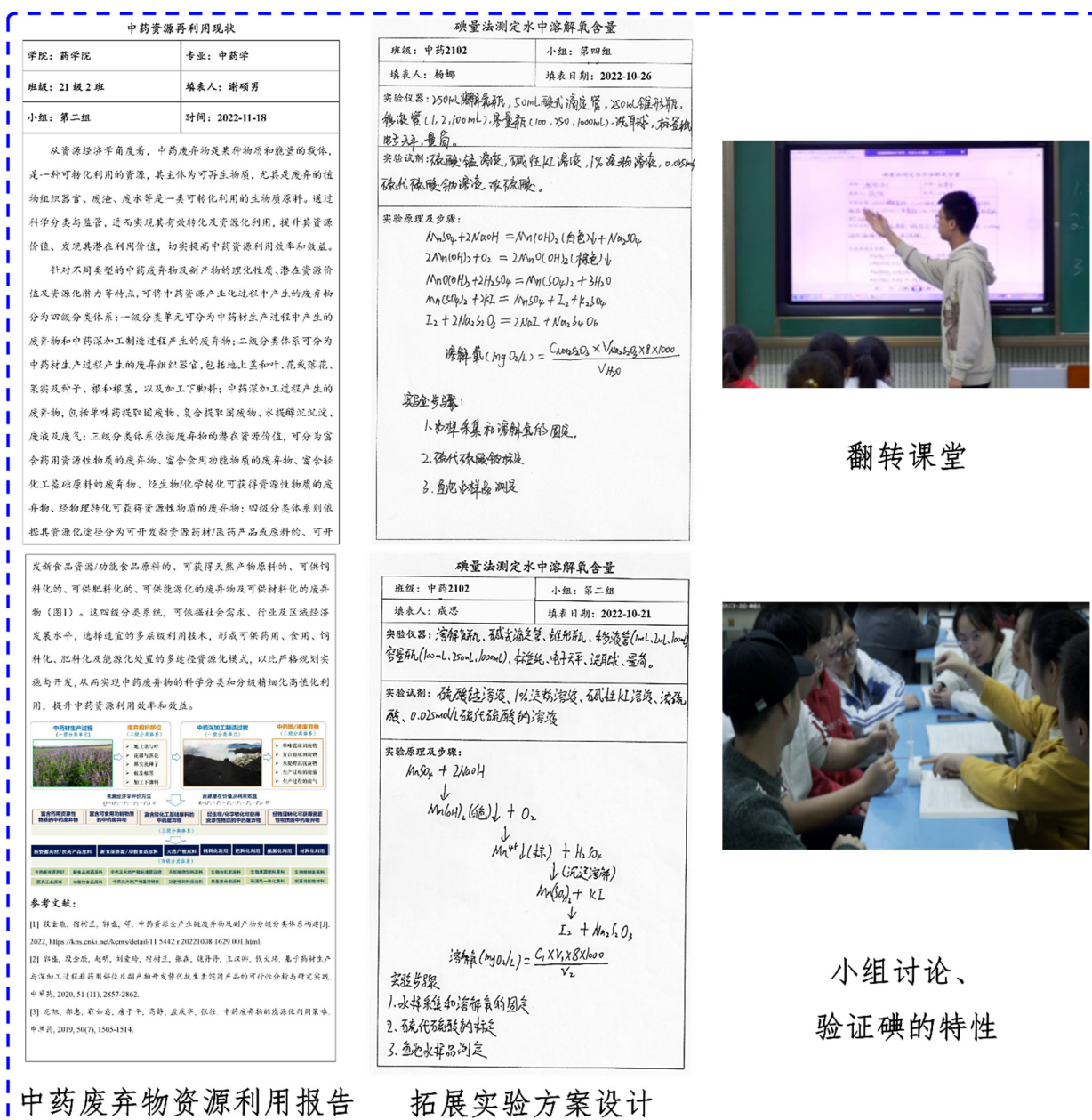
图3 学生活动及课后作业

如表1所示。教学过程中，学生小组间形成良性竞争关系，各测评结果显著优于传统讲授教学，学生思考问题的深度、覆盖面和逻辑性得以提升。为了准确掌握在分析化学教学中融入思政要素对学生价值观及科研素养的影响，选取药学院100名中药学和药学专业大二学生线上进行爱国主义态度和科学精神问卷调查。统计有效问卷共计100份，有效回收率为100%(表2)。从学生问卷调查数据分析结果可知：将思政要素融入分析化学专业课程教学中，可有效提高大部分学生学习的积极性、自主性，提升学生的环保意识、爱国情怀和职业责任感，增强学生刻苦钻研、吃苦耐劳的科研精神。针对少数存在问题的学生，在教学、实验过程中通过提问、督促、交谈等方式掌握学生动态，以提高学生学习的积极性和参与度。