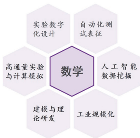
图1 数学在化学科学中的应用

现代化学科学是在原子或分子水平上, 研究物质的结构-性质关系、物质的变化规律等的学科, 从而指导人类合理地利用和改造物质。从化学学科的发展角度看, 著名化学家Löwdin教授曾强调, 基础研究就是研究物质理论的数学结构。近年, 伴随多学科间的交叉互融和化学研究的范式转变, 加之数字化、信息化、智能化技术的突飞猛进, 定量地理解化学问题、理性地设计目标物质、准确地预测结构-功能关系已经成为现代化学科学中最重要的一环, 这可以帮助我们更深刻地掌握化学问题的本质和规律, 提高理性认识水平, 加速新化合物和材料的研发和转化, 缩短研发周期、降低研发成本。在这一过程中, 数学则扮演了至关重要的作用(图1)。