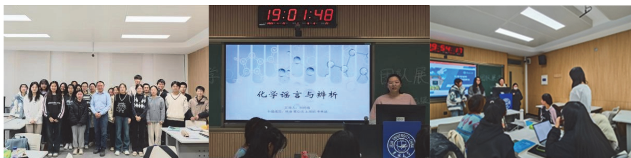
图3 学生团队汇报展示与质疑答辩现场照片

小组研讨和团队汇报展示的形式加深了同学们对课程知识点的认识，也加强了小组成员之间沟通协作的能力，锻炼了学生批判性思维能力、逻辑思考能力和演讲能力，有效提升了学生的综合素质(图3)。