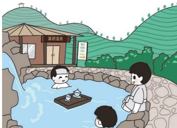
图3 富硒温泉与富硒茶山

对了，大家一定要去泡一泡明月山下温汤镇的富硒温泉(如图3)，古井泉街的温汤古井，出来的是富硒温泉水，常年都有六七十度，对风湿、关节炎、肩周炎、腰椎等有较好的疗效。也可以去尝试街上随处可见的泡脚店和足疗店，这里蕴含很深的富硒泡脚文化，你们一定会有不一样的体验的！”