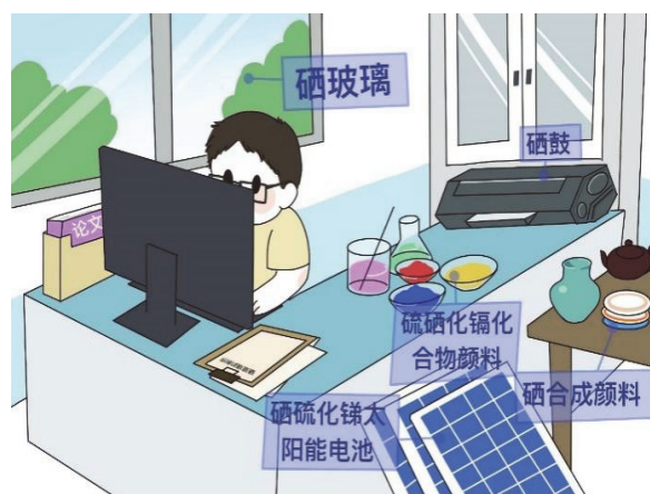
图4 各奔东“硒”的科学家

硒侠客对科学探究有着难以磨灭的热情，实验室里是他忙碌的身影，桌面上的图纸修改一遍又一遍，微弱的光线下，他戴着眼镜翻看已经泛黄的书页，面对前人的经验孜孜不倦。尽管如此，困扰多日的谜团始终没得到解决，一味的钻研和模仿并没有让他进步，在无尽的失败和疲惫中，他回忆起之前在红石镇和宜春城的经历，想起他囊中的硒元素是否也对所研究的这些东西有特殊作用呢？硒侠客迫不及待地跑去实验室，取下锦囊中的少量硒元素进行探究，时隔多日，他再一次发现硒元素的其他功能(如图4)。