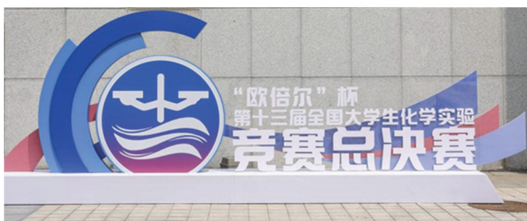
图2 第十三届全国大学生化学实验竞赛总决赛打卡处

为了方便参赛学生和参会教师摄影留念，还特意在主会场楼前设计构建了打卡点，如图2。