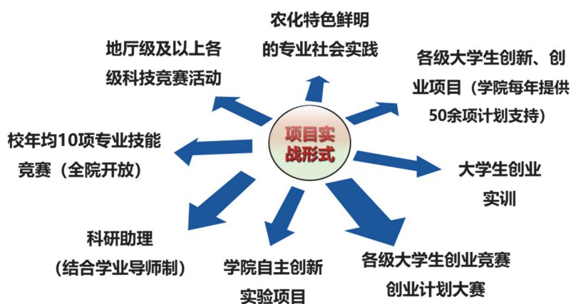
图3 大学生创新实践活动载体形式

平台为学生开展创新实践活动提供了场所,如何有效利用这一载体开展创新实践活动、培养高素质创新应用型人才是关键问题 [13] 。教学及科研“三层面”实验(训)平台实行共享、开放式管理,在第一课堂训练基础上,吸引学生早进实验室、早进教师团队、早开展科学研究,主动将专业优势及科研资源转化为创新应用型人才培养的资源,是高等教育培养创新人才、提高学生素质的客观要求。此外,学校还将创新创业教育融入培养方案,纳入必修学分体系,并常态化提供丰富的项目载体促使学生创新实践能力培养计划落地落实(图3)。同时,不断健全校院二级管理制度,将教师指导学生工作作为岗位竞聘的门槛条件,并纳入考核以及绩效奖励范畴,激励教师发挥在引领学生创新实践活动中的重要作用。