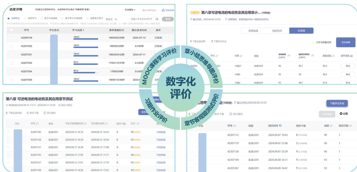
图6 数字化评价组成

利用线上教学平台辅助教学进行数字化评价,一方面提高了评价效率,另一方面也为学生学习体验的提升以及促进教育公平方面提供了有力支持。