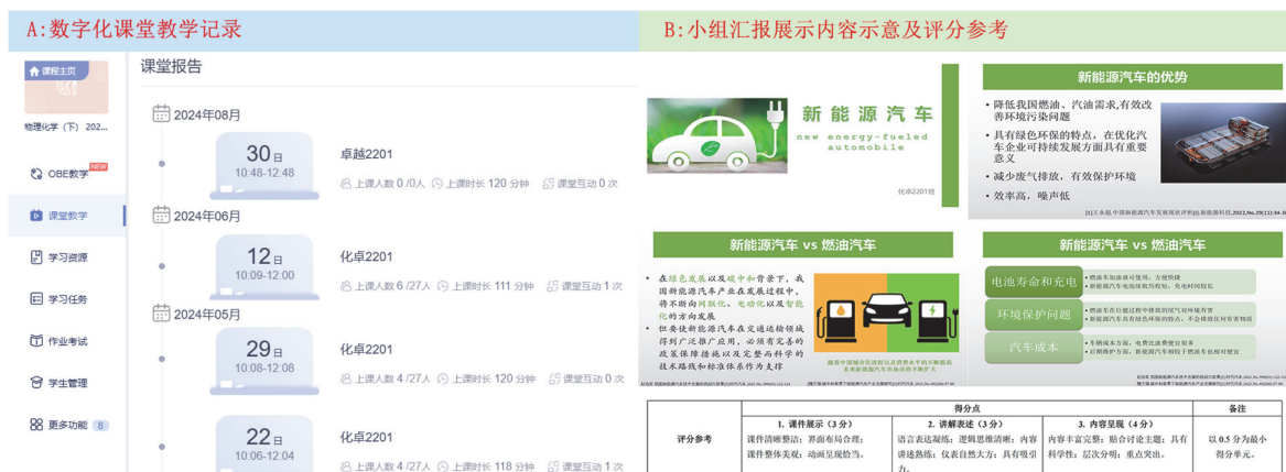
图3 (A) 数字化课堂教学记录; (B) 小组汇报展示内容示意及评分参考

学生们更好地理解电化学相关理论，进一步认识到该学科对人们日常生活乃至社会发展的影响。各小组不同的汇报主题可以激发学生之间的思想碰撞，培养学生批判性思维和深度思考能力。此外，教师在小组汇报展示环节中也扮演着引导角色，对汇报内容进行点评、补充以及指导，增强学生主题汇报环节的有效性。