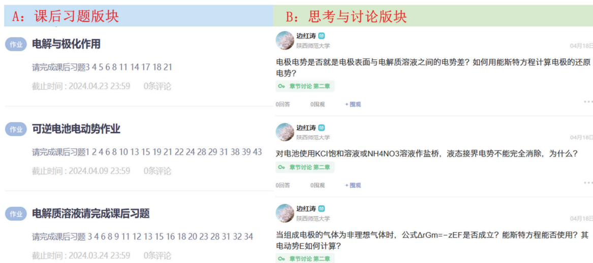
图4 (A) 课后习题版块; (B) 思考与讨论版块

课后习题作业是学生巩固课堂知识的重要手段。通过SPOC平台,教师可以布置多样化的作业形式,如课后习题作业提交平台(图4A),教师网上批改,学生习题作业电子版作为资料可以保留,方便复习使用。教师还可以在平台上发布思考与讨论题目(图4B),鼓励学生进行深入的思考和探讨,互相交流想法。此外,SPOC平台还支持小组合作探讨,通过这种方式,学生可以在课后进行合作学