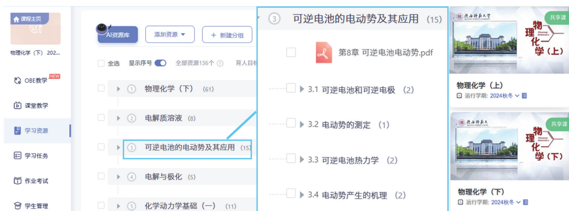
图2 智慧树SPOC平台上预习资源展示

单独的预习可能会遇到一些难以解决的问题和疑惑。为此,教师鼓励学生通过学习小组,定期进行讨论和交流。通过小组讨论,学生可以分享各自的见解和思路,互相启发和借鉴,共同探讨在预习中所遇到的疑问,促进生生互动,启发高阶思维 and 创新能力。