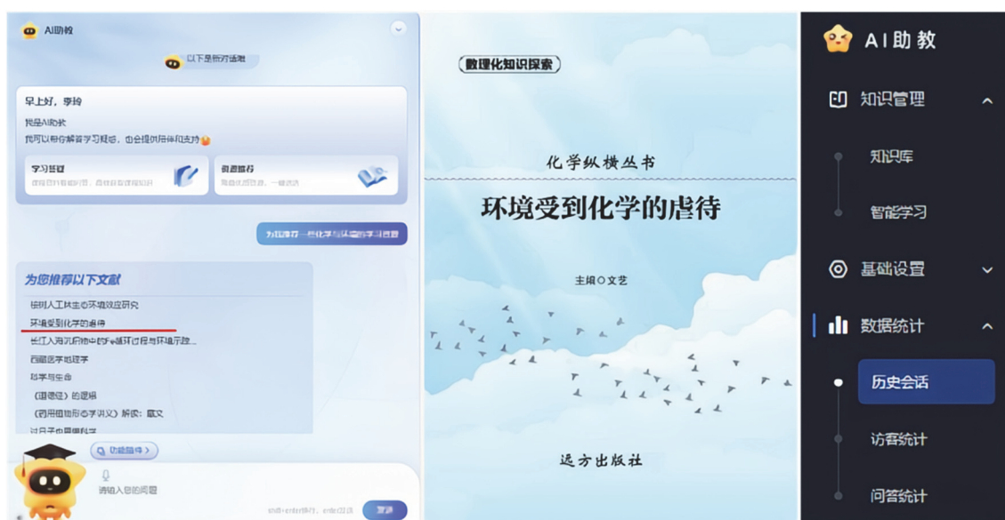
图3 AI助教推荐的学习资源与AI助教的数据分析

AI助教是教学场景中衔接教师与学生的桥梁，能够通过人工智能、数据挖掘、行为识别、推荐系统等技术采集学生的行为数据及学习数据，供教师进行分析，获取反馈，调整教学策略。基于此，开设了AI助教，上传课程相关的各种学习资料。AI助教基于教师上传的课程资料，随时回答学生的提问，推荐学习资源，如图3所示。学生可以通过AI助教的人机互动，提出自己的问题，AI助教则可以给出回答及来源。例如，学生提问“光化学烟雾是什么？”AI助教的回答是“光化学烟雾主要来自于机动车、工厂等污染，是排入空气中的碳氢化合物(CH)和氮氧化物(NO x )等一次污染物在阳光的照射下会发生光化学反应，从而产生臭氧(O 3 )、醛、酮、酸、过氧乙酰硝酸酯(PAN)等二次污染物。光化学污染就是指参与光化学反应过程的一次污染物和二次污染物的混合物所形成的烟雾污染”，并给出此回答的来源，如图4所示。由图可知，主要的来源为无机化学相关的教材，还有《一口气读完化学常识》。学生可以根据推荐的来源进行筛选和进一步阅读。