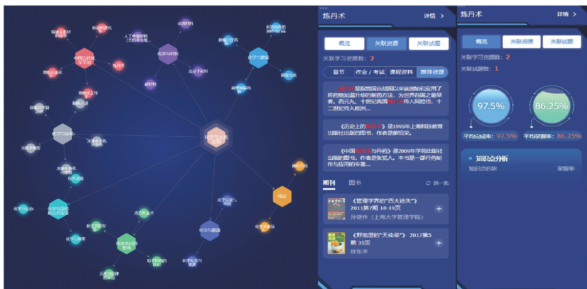
图2 “化学与人类文明”知识图谱与知识点导航、评价样例