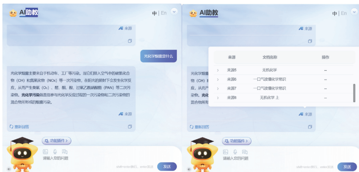
图4 AI助教的回答及提供的来源