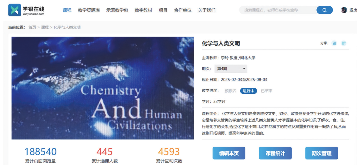
图1 “化学与人类文明”线上教学内容主题

随着信息技术的不断发展及设备智能化、信息化程度的不断提高,知识图谱技术因其强大的知识组织、管理、表示能力以及支持的数据/知识驱动相关方法,受到领域内学者广泛关注。知识图谱是由各种知识或数据单元经过抽取等处理而组成的一种结构化知识库,用于描述和表示实体、概念、事实和关系等信息 [9] 。建设线上课程的知识图谱,关联学习资源,将碎片化的资源进行重构、整合,形成清晰的课程知识点脉络及资源归纳;通过知识点的打散重组,实现资源的有效关联,用于学习导航,让学生在学的时候有侧重点地进行预习和复习,并可以实现个性化学习路径与学习资源的推荐(如图2所示),让学习满足不同学生的个性化的需求。学生通过知识点的学习,逐渐将课程的学习内容由点到面地掌握。同时,也帮助授课教师对知识点学习情况进行评价,精准掌握学生的学情。