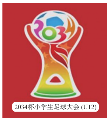
图1 “2034杯”小学生足球大会赛事LOGO Fig. 1 “2034 Cup” primary school football conference logo

首先,2034年是世界杯年,届时正处当打之年的2009年龄段的球员将会是国家队所倚仗的主力军,如首届“2034杯”参赛球员均为2009年出生的国内法定小学6年级即将毕业的在校学生,允许每队报名3名