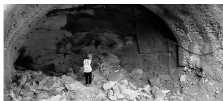
图6 一个循环破岩后的掘进效果实景图

环约需要4 d,相当于一天的钻孔、爆破一次。经过不断总结、改进,掌握了钻孔、清孔、装管、堵塞(包括调和砂浆配比)、充气、防护的工序衔接后,每天可以钻孔、爆破2次,最终实现2 d一个循环,平均循环进尺接近2.5 m。