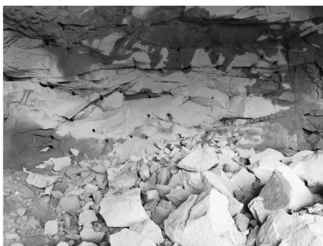
图 3 掏槽破岩后的实景图 Fig. 3 Real scene after cutting and breaking rock