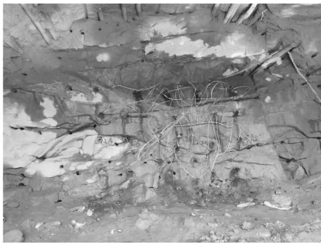
图 2 掏槽破岩起爆前的实景图(白色的是充气管) Fig. 2 The real scene before rock cutting and blasting (the white one is the inflatable tube)