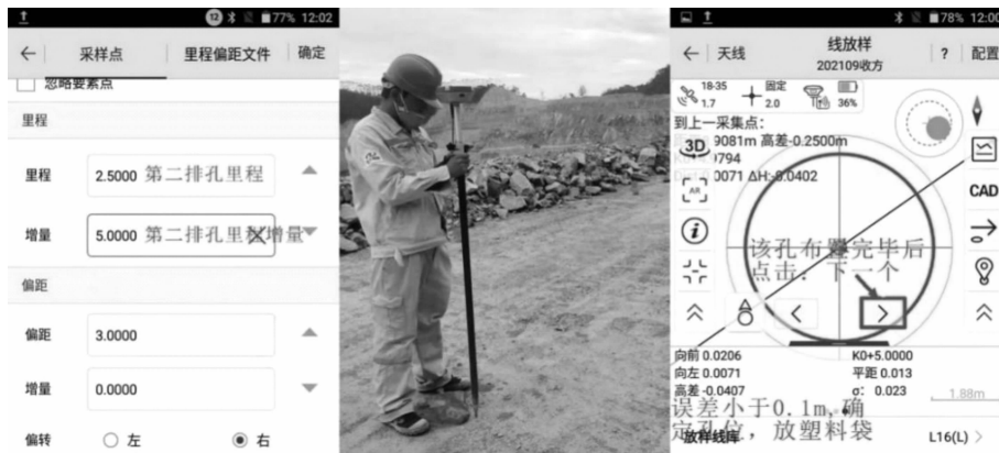
图 9 第 1 排孔布置方法示意图

上述的设置方法设置第 2 排孔的里程、里程增量、偏距、偏距方向, 设置完成后按照上述布孔方法布置第 2 排炮孔, 如图 9。