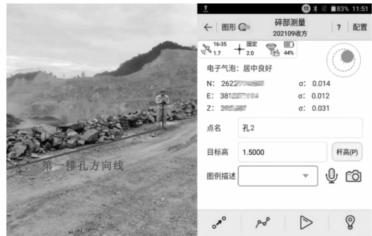
图5 第1排方向线其他任意点坐标采集示意图 Fig. 5 Other arbitrary coordinates of the first row direction line