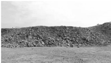
图10 皮尺布孔法爆破效果

图10所示的是传统布孔方式爆破后的爆堆表面岩石分布情况,可以看出爆堆表面大块岩石较多,且分布不均。而图11则展示了使用RTK布孔技术后爆破效果的显著改善,爆堆表面大块岩石明显减少,岩石碎片分布更加均匀。这两张图直观地展示了皮尺布孔法与RTK布孔法之间的优劣对比。