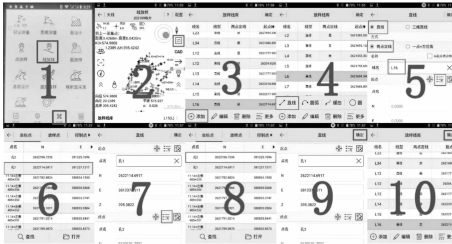
图6 第1排方向线添加流程图 Fig. 6 Flowchart in the first row direction line