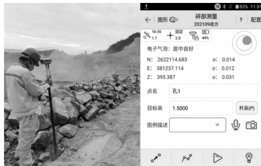
图 4 第 1 排第 1 个孔坐标采集示意图

第 1 个孔布置完毕后,使用 RTK 碎部测量采集第 1 个孔坐标,并记住该点的名称,如图 4。