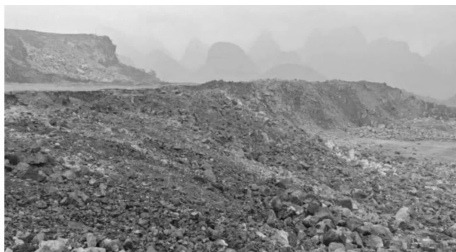
图11 RTK线放样布孔法爆破效果