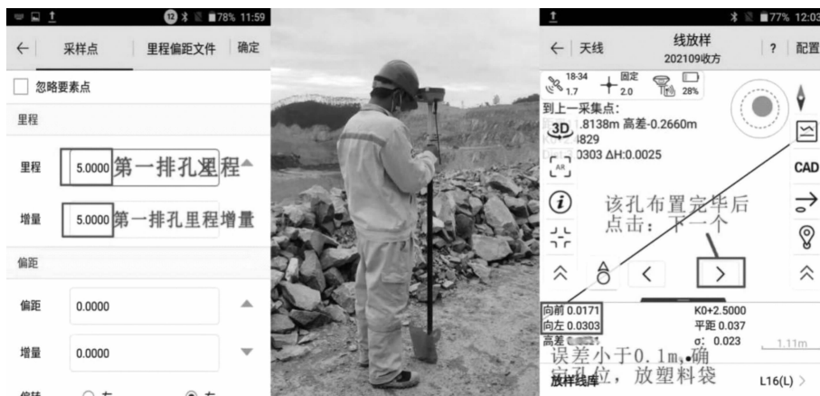
图 8 第 1 排孔布置方法示意图

如图 8), 设置完成后, 点击确定开始线放样布孔, 首先根据提示布置第 1 排第 2 个孔 (精度控制在 0.03 m 内, 即提示向前后向后距离小于 0.03 m, 向左或向右提示距离小于 0.03 m, 如图 8, 第 2 个孔布置完毕后点击“下一个”按钮 (图中方框内的按钮, 也可以按键盘向右按键), 根据提示布置第 1 排第 3 个孔, 以此类推布置第 4 个、第 5 个…… (若线放样提示为向南 (北)、向东 (西), 可在线放样配置中将线放样提示改为向前 (后))