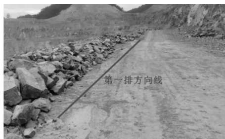
图 2 第 1 排孔位置和方向示意图