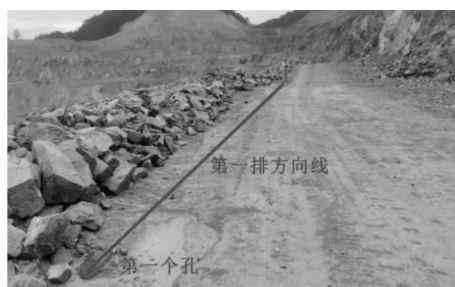
图 3 第 1 排第 1 个孔布置示意图