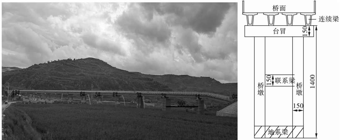
图 1 桥梁结构图(单位:cm)

的现浇板,由于桥梁属于新建桥,混凝土标号较高,结构尺寸较大,整体性较好。桥梁共计 13 跨,南北各一个承台为 0#和 14#,1#~13#共 13 排桥墩,桥墩跨距为 30 m。桥墩为直径 1.5 m 的 2 根圆柱形,桥梁高度为地系梁上 12.8~14 m 不等;地系梁以上 7 m 处为高 1.5 m,宽 1.2m 的联系梁;台帽长 11 m,宽 2.0 m,高 1.5 m;桥面由 4 根预制连续箱梁支撑,预制箱梁壁厚 0.2 m。详见图 1 桥梁结构意图。