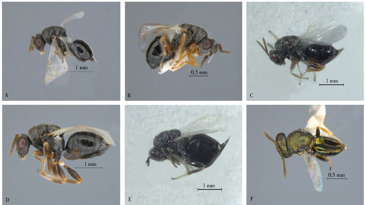
A. 内蒙黄芪籽蜂; B. 黄芪种子小蜂; C. 拟京黄芪籽蜂; D. 北京黄芪籽蜂; E. 圆腹黄芪籽蜂; F. 黄芪种子金小蜂 A. B. mongolicus ; B. B. huonchili ; C. B. pseudobeijingensis ; D. B. beijingensis ; E. B. ciriventrios ; F. H. huonchei

籽蜂的发生;2022年共发生6种,其中黄芪种子小蜂为浑源县的优势种,2021、2022年分别占调查总数的43.90%、35.38%。