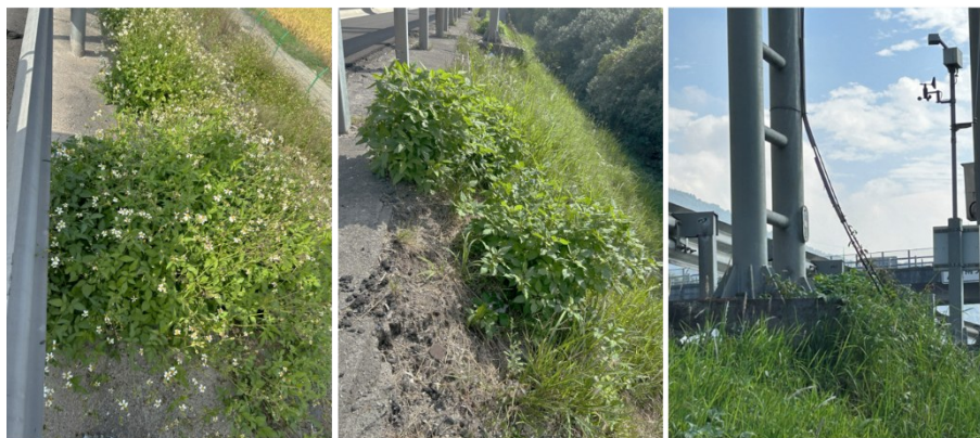
图1 温州绕城高速公路边坡杂草情况

温州绕城高速公路是环绕温州都市圈的一条省级高速公路,规划总长度约154 km,连接温州乐清、永嘉、鹿城、瓯海、瑞安、平阳、龙湾、洞头等区域,沟通沈海高速公路、温丽高速公路、诸永高速公路、龙丽温高速公路、沿海高速复线等线路。由于温州市雨热资源丰沛,利于植物生长,绕城高速公路边坡广泛存在杂草滋生、入侵的情况(图1),严重影响道路安全和城市美观。