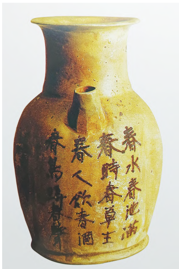
图3 青釉褐彩诗文壶

入唐,长沙窑(又称铜官窑)作为“南青北白长彩”三足鼎立的重要窑口,其陶瓷上的书法以“民间性、装饰性、真实性”为核心特征,是唐代民间文化与书法艺术结合的典范。陶瓷书法均由普通窑工书写,属于“非名家书法”范畴。与唐代名家书法(如欧阳询、颜真卿)的“精英化”不同,其书法并非独立的艺术作品,而是与陶瓷器物紧密结合的装饰元素——为适应壶、瓶、罐等器物的圆弧坯体,窑工需快速完成书写,因此呈现出实用与审美兼顾的特点,呈现了大唐民间书法的原始面貌。其字以楷书、行书为主,间有行草。楷书如“君生我未生”诗词壶(长沙博物馆藏),褐彩书写的楷书笔画工整,却因坯体弧度略有倾斜,增添了几分灵动;行书诗文壶,则书写流畅自然,布局洒脱,有大唐书家余韵。这些陶瓷书法,有别于名家书法的“修饰笔法”(需反复调整笔锋),长沙窑书法采用“打破常规”的装饰笔法——为适应陶瓷烧制的“一次成型”,窑工简化笔画、省略细节,呈现出稚拙生动、千姿百态的美感。如长沙铜官窑遗址藏唐代长沙窑瓷器——青釉褐彩诗文壶(图3),其上写有五言诗一首,其中“春水春池满,春时春草生”中,重复的“春”字,因书写速度快,笔画略有简化,却更显活泼。这些陶瓶因是手工批量生产,故所书潦草随意,反映了唐代民间书写的原生状态,没有刻意的修饰,体现了“民间书写”的真实性。