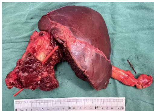
图2 HAE病灶侵犯重要管道而功能尚完好的“废弃肝” Figure 2 Discarded liver with invasion of critical ducts by HAE while preserved liver function remains

也同样具备功能性“废弃肝”的特征(图2),能否将其应用于上述场景的濒死肝功能衰竭患者的救治,需要进一步临床与医学伦理的探讨。