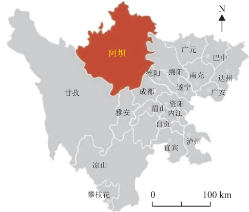
图1 川西北阿坝州地理位置图

除了自然活动对生态环境有着重大影响,更多的是人类工程活动对生态环境的影响,主要影响当