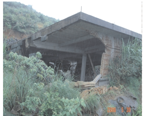
图3 简易挡墙又作房墙的后果

(2)“坡十十”Ⅱ情形。紧靠坡(主情形:房屋墙体紧靠切坡。即:房墙距边坡几乎为零)+叠建坡(房屋沿边坡的纵向无序叠排建造,相互影响密切)+耕作坡(房屋四边的坡上有茶园、竹园、菜园、简易水池或水渠)+筒合墙(简易挡墙也是房墙)。