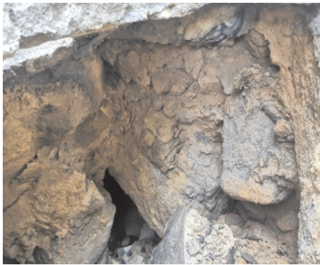
图1 崩坡积碎石土层实景图

变;因气候湿热、风化作用强烈,斜坡上残积和残坡积物发育,在坡麓地区,大量发育坡积裙;其土体力学性能低、土体又存在风化差异面或堆积面,土体滑坡、崩塌发育 [8] ,陆域95%以上为地质灾害易发区。经工程勘查和走访调查,境内山区许多边坡覆盖着一定面积、厚度不等、稳定性差而危害性大的崩坡积碎石土层或冲洪积卵石层(简称“两个层积层”,如图1、图2)。以崩坡积层为例,其埋深在地表以下几m~15m、局部>20m、个别>40m;崩落岩体形状不一、块度不等、单体几cm~几m、甚至十几m,堆积无序、空隙多且无规则、不密实,是水的良好通道;崩积层数一般1~2层、个别达3层、层间分明 [9][10] ;通过对多组具有代表性岩芯(①不同地灾点,②同一地灾点的不同位置,③同一钻孔的不同部位)等资料 [11-14] 综合分析,之所以有崩坡积层,初步推测不排除全新世之后的新构造运动,待后期研究验证。