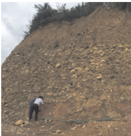
图2 冲洪积卵石层实景图