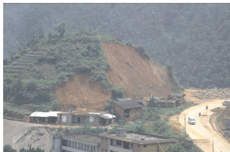
图5 “坡++”情形不处置而造成的后果实景图

(2) “坡++”Ⅰ→“坡++”Ⅱ情形,是孕灾外力再补给的助推器,使孕灾的“可能”一步步靠近“风险”、直至“现实”,使构成地灾的必要维度更加具备,这是构成地灾的转折、诱发地灾的初源,地灾风险区由此潜伏,并伺机形成和发展。如能做到早期识别、及时纳管,那就姓内,否则又是姓外。这是姓内、姓外的分水岭,是第二、第三道防线,此时介入的防范效果虽不及第一道,但为之仍不算晚。