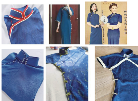
图4 阴丹士林布制作的现代旗袍

当今,阴丹士林布也深受现代旗袍设计师的喜爱,阴丹士林布的青蓝色最为经典,它比其他面料的颜色更加鲜亮,因此现代旗袍的制作中还是以青蓝色为主。为更贴合现代人的审美,结合民国画报月份牌的蓝色旗袍,设计师在缙边上潜心钻研,设计了红、白双缙,红色单缙,浅蓝色线香缙,黑色单缙,香槟色、浅金色、淡绿色单缙、黑白两缙夹一嵌,乳白色宽缙等多种搭配方式的旗袍(图4)。部分设计师还在保留阴丹士林布气质的基础上,对民国经典阴丹士林布旗袍进行复原,复原不是一比一的复制粘贴,而是在旗袍部分细节,如襟形、开叉、盘扣等方面进行创新设计,使其更符合人体工学,让更多人选择穿着阴丹士林布旗袍。