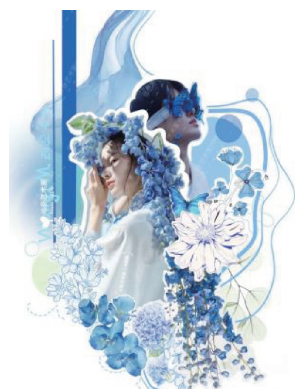
图 1 不同的蓝色层次

蓝印花布最显著的艺术特征是蓝、白 2 种颜色的对比搭配,以此为基调又有 2 种形式:蓝底白色花纹和白底蓝色花纹。正是由于这个最为突出的艺术特征,蓝印花布在享誉盛名、形成独特风格的同时,也在一定程度上被限制了自身的发展。现代蓝印花布在保持色彩对比这一艺术特征的前提下,对其中的“蓝”做足了文章,在色相、饱和度、明度等方面进行创新,开发了更多不同的色彩组合和色阶层次,将传统的色彩基调与流行色相结合,形成了千变万化的对比效果(图 1),营造更为丰富的色彩氛围来反映各种的心理效应,对传统的“蓝白”赋予新的情感,将研究的新色彩搭配运用于现代旗袍设计(图 2),开辟了广阔路径,是满足多元化消费者需求的必由之路。 [6-7]