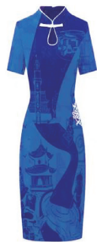
图 2 蓝印花布现代旗袍

对传统蓝印花布进行研究发现,传统蓝印花布的图案内容具有民间特色和传统意蕴,主要以吉祥喜庆的纹样为主,有动植物图案,也有抽象的几何图案,传统题材结合传统形式,并不受年轻态消费群体的欢迎,且图案形式呈现的视觉感相对比较单一,也限制了蓝印花布的进一步发展。