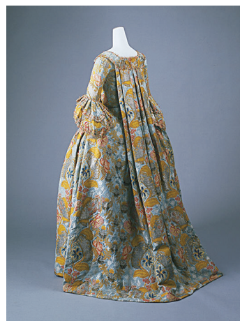
图1 洛可可时期的瓦托·普利兹

作于1760年、现收藏于大都会博物馆的洛可可时期的瓦托·普利兹(图1),其在领口边缘装饰有带褶皱的花边,从肩胛骨上方向下延伸至裙摆末端,走动时异常飘逸。到了帝政时期,大拖尾与罩裙分离,仅保留胸口处面料,并通过肩带起到固定服装和提拉胸部的作用。如图2所示的一款约制作于1809年、现收藏于大都会博物馆的红色天鹅绒大拖尾裙装,穿着者从后往前穿着时,应先套上肩带,再将拖尾两旁的带子向前绕到胸口处固定。拖尾长度、材质、刺绣等都依据穿着者的身份、地位而有所不同,通常身份越高拖尾越长 [2]77 。