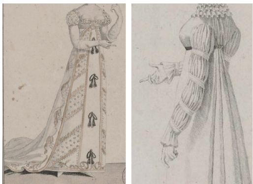
图 12 帝政时期女性长裙及袖子细节