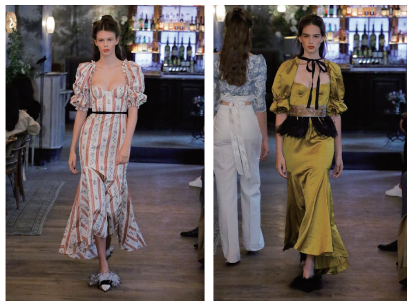
图9 Brock Collection 2019 春夏时装秀