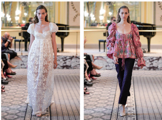
图 11 Brock Collection 2020 春夏时装

“泡泡”的数量,并将其与 U 型低领相结合实现元素的创新性应用,且面料与帝政时期简单朴素的白棉布不同,在颜色和图案上更偏向于洛可可时期的服装样式。