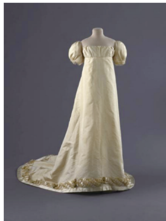
图4 由丝绸、塔夫绸、蕾丝制成的帝政长裙

丝织技术的发展使服装开始出现更加精致的蕾丝或刺绣装饰,丝织纹样也由原先的平面图案变得立体鲜活 [5] 。新古典主义前期,白棉材质的长裙上常对称或均匀刺绣有同色的花草、羽毛图案,虽然颜色相近,但薄棉织物的通透使裙子穿着时透过光线可看到花纹,展现轻盈、飘逸的美感。帝政时期为配合高级面料的质感,则盛行在长裙裙摆和大拖尾上点缀精致、华丽的金色刺绣。图4所示为一款制作于1804—1815年、现收藏于巴黎时尚博物馆,由丝绸、塔夫绸、蕾丝制成的帝政长裙。