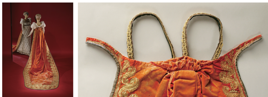
图2 红色天鹅绒大拖尾裙装的整体与细节图