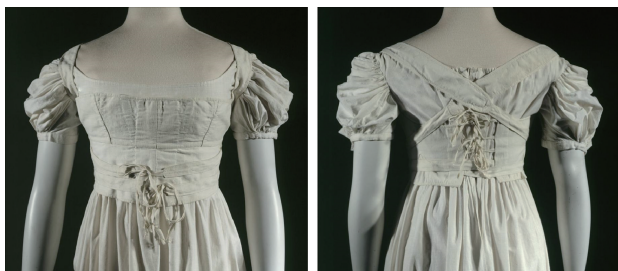
图3 帝政时期紧身胸衣的正、反面