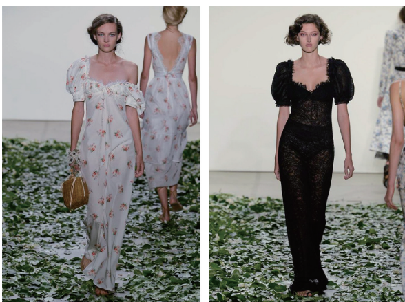
图7 Brock Collection 2018 春夏时装秀

不仅将典型的帝政方形低领和蓬松的短帕夫袖(图8)融入现代时装,更是将V领与方领相结合,设计了独特的偏V型方形领口,宽大的袖子能在视觉上增加肩宽,凸显女性腰部的纤细,极高的腰线能更显身材修长,长裙使用微透的丝质面料制作,在保留苛尔莱特领边的同时,将原来的布领饰改为蕾丝材质,增加了精致感。这2条长裙在下摆处不添加繁重的装饰,简洁修长的裙身更偏向于新古典主义前期的帝政样式,给人以古希腊、古罗马时期的自然原生之感。