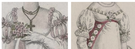
图10 帝政时期的袖子及装饰