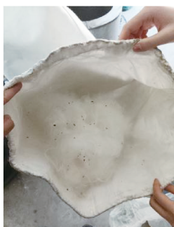
c) 上收集器收集的纤维