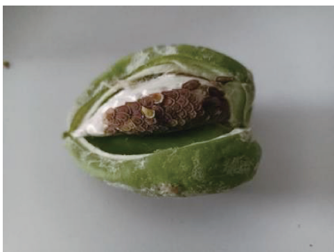
图 4 成熟度好的牛角瓜鲜果