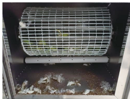
e) 微波箱底收集的纤维