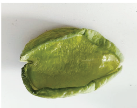
b) 微波开果提纤设备提纤后的果壳