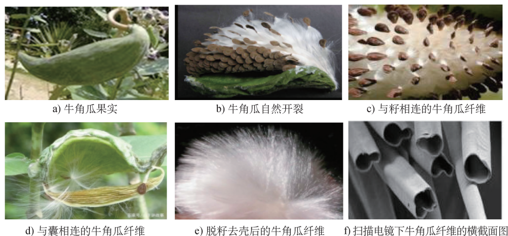
图 1 牛角瓜果实和牛角瓜纤维

机械提纤是一种纺纱用的纤杂分离装置,该装置由分离系统、喂入系统、纤维收集系统和分层除杂系统组成。机械提纤过程中机械打手会对纤维产生很大的损伤,同时囊也会在加工过程中被打碎黏附在纤维上,提纤得到的纤维质量差、含杂率高,不利于后续加工。人工提纤的效率相当低,1位工人需耗费8h才可提纤1kg的牛角瓜纤维,人工成本高,且由于纤维自身含杂率较高,籽和囊很难去除,囊易破碎,故手工提纤后纤维含杂率仍较高,其提纤效率和纤维质量远达不到后续纺纱加工对纤维的要求。干燥的壳与囊很容易碎裂,且混在纤维上的籽也很难被快速、完全地去除,故提纤效率、提纤质量低下,无法达到高品质、规模化提取,极大地限制了纤维在纺织领域的产业化应用 [7] 。