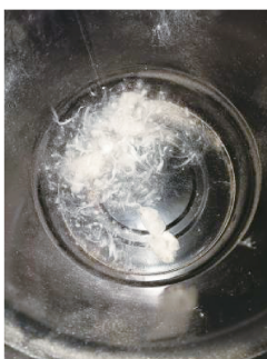
d) 下收集器收集的纤维