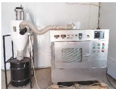
a) 牛角瓜微波开果提纤设备照片

试验选取从云南采摘的成熟度较好的牛角瓜鲜果。牛角瓜鲜果的成熟度可以籽的颜色深浅进