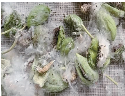
图 5 阴干 2 周后的牛角瓜

分在微波和高温的作用下使果实内外产生压力差,果实发生爆裂,纤维和果壳分开。微波高档时间和微波保温时间的设定可以根据牛角瓜的成熟度和果实数量来确定。由于成熟度好的果实含水率低,温度上升所需时间少,因此成熟度好并且果实数量少时,微波高档时间应设定得较小些。微波保温时间还受环境温度的影响,环境温度较高时,保温时间可以设定得小些。风机提供的一定温度的热风除让纤维内的水分快速蒸发外,还有利于纤维和籽囊的分离;风机的风量还会影响纤维的收集,风量过低则会使很多纤维留在微波箱底,致使上收集箱和下收集箱中收集的纤维变少。物料温度即牛角瓜表面温度的设定可使牛角瓜维持在某一恒定温度,以防止牛角瓜在微波作用下温度过高而损伤纤维。物料温度的设定需考虑果实的数量和成熟度,若果实数量大、成熟度差,则物料温度应设定高些。果实数量不宜过多,因为过多会影响牛角瓜果实在滚筒中的正常翻滚,无法均匀受热,导致提纤效率下降、提纤质量变差。经多次试验,本研究总结的牛角瓜果实提纤设备具体试验参数如表 1 所示。