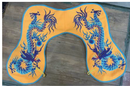
图10 采用三蓝绣和盘金绣工艺制作的双龙戏珠云肩

图10为采用三蓝绣和盘金绣工艺制作的双龙戏珠云肩,它充分展现了传统手工艺的非凡魅力。而随着数码设计、先进的织物加工技术等新技术的融入,云肩的制作不仅延续了传统工艺的精髓,还拓展了创新的可能性,使作品别具特色,兼具传统韵味与现代审美。