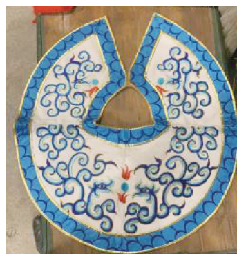
图 14 凤图案

衡。社会的转型影响了人们对于云肩设计及其意义的理解,社会经济结构、文化形态和价值观念等的变化也反映在云肩的设计中,使云肩展现出更加丰富和包容的特征。技术进步不仅提升了生产效率,还拓宽了材料和工艺的选择范围,为云肩的制作带来了前所未有的可能性。同时,全球化和跨文化的交流也使云肩开始融合外来文化元素,呈现多元和跨文化的特性。莆仙戏服云肩美学已变成一个多元文化融合的象征,它不仅承载着来自时尚界、社会思潮、技术革新和国际文化交流的多重影响,也展现了更为开放和包容的艺术风貌。这一发展不仅丰富了云肩自身的文化意义,也为传统戏剧服饰的现代化演绎提供了宝贵经验,给人以启示。