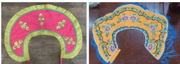
图9 采用化学纤维材料制作的云肩

云肩的发展不仅涉及外观设计、色彩搭配,更体现在材质的创新运用上。传统云肩的材质主要为丝绸和棉织物。丝绸特有的光泽与柔软触感,十分契合莆仙戏中达官显贵角色的华丽气质,云肩采用丝绸材质,在舞台上更能突显角色身份,展现莆仙戏对角色身份细致刻画的传统;棉织物凭借良好的透气性和舒适性,制成的云肩能使演员表演更自如,表现平民角色时尤为贴切,能体现莆仙戏注重表演实用性与贴近生活的风格。但丝绸易受损、成本较高,棉织物则易皱褶、吸水变形,随着现代纺织技术的发展,化学纤维(如涤纶、锦纶等)逐渐被广泛应用于云肩,图9为采用化学纤维制作的两款云肩,它们不仅具有类似丝绸的光泽,而且更易于护理,耐用、轻盈,更具实用性。