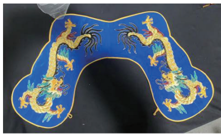
图8 以蓝色为底色的云肩