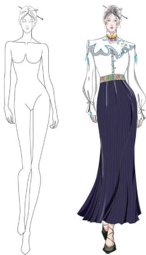
图 17 服装设计效果图

设计将莆仙戏服云肩的美学元素巧妙融入现代服装,打造出兼具传统底蕴与现代时尚感的高雅时装。如图 17 所示,服装整体风格融合了时尚与舒适的理念。衬衣运用胸省剪裁工艺,依据人体胸部曲线精准处理省道,使衬衣能够紧密贴合身形,勾勒出优美的上身线条。同时,衬衣整体以 H 廓形结构为基础,H 形简洁轮廓既能保证穿着空间、避免束缚,又与修身剪裁相得益彰,尽显工艺精细。袖口的开衩与系带设计,美观别致,可按需调节;中式盘扣与非对称云肩的搭配,在传承文化精髓的基础上大胆创新,别具一格;通过巧妙的腰线设计与百褶工艺,A 形长裙有效优化了穿着者的体型比例,吸引视线焦点,尽显优雅气质;精致的褶皱处理,赋予服装灵动的流动美感;分离式云肩可根据不同场合灵活拆装,大大提升了服装的实用性。整体设计完美融合了传统元素与现代设计理念,充分展现设计师深厚的文化底蕴与高超的设计水准。