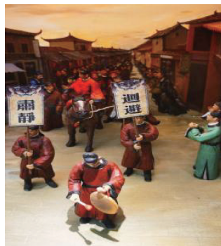
图1 古代莆田、仙游地区科考中举场景

云肩以其独有的设计和形制在莆仙戏的舞台上彰显了戏剧美学的深层文化特色,对塑造角色、推进剧情发展起到了关键作用。莆仙戏云肩的设计与形态受历史、社会习俗和文化传统等众多因素的共同影响,并随着时代的发展不断演变。传统的云肩风格多