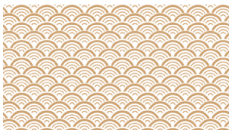
图 21 祥云底纹

通过对传统莆仙戏服云肩图案美学元素进行现代演绎与巧妙融合,本设计并非对传统图案的简单复刻,而是促使传统文化与现代审美展开深度对话,意在推动传统艺术形式的创新发展,并为现代女装设计注入全新活力。这一持续创新的过程,不仅是对传统文化的尊崇与致敬,更为当代女性提供了彰显独特个性与高雅品位的时装选择。不同的图案组合与设计,能够适应多种场合,满足穿着者在正式、休闲等不同场景下的表达需求,进一步印证了传统图案设计元素在时尚领域的持久影响力与广泛适用性。