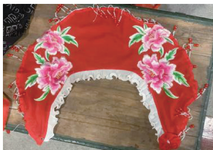
图 12 牡丹图案