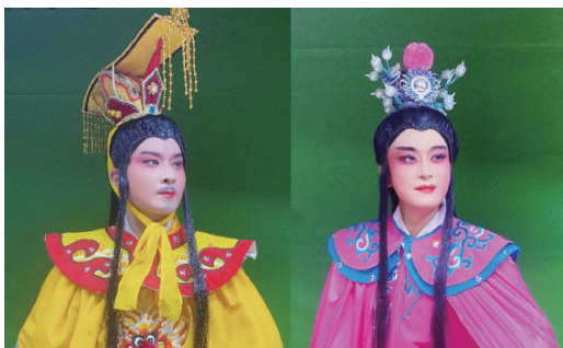
图4 半圆形云肩实例

以其独特的造型备受注目,它以门襟所在直线为对称轴,形成规整的八边形结构,体现了对称美和几何美感,能生动展现特定角色的身份与气质,细腻传达角色的内心情感,如图5所示。波浪形云肩,也称女蟒肩,其流畅的动感及柔美的曲线魅力具有典雅的韵律感,常用于达官显贵家女性角色的服饰搭配中,如图6所示。在武生角色的塑造上,方形云肩有着不可或缺的地位。如图7所示,搭配方形云肩的男式硬靠十分典型,方形云肩的凹字形设计配合角色动作,突显英武之气,与男式硬靠整体轻便的造型相得益彰,既能适应高难度的武打动作,又进一步强化了角色形象。云肩作为莆仙戏剧服饰的重要组成部分,不仅丰富了角色服装的视觉效果,而且深化了剧中人物情感的传递,是连接传统与现代、艺术与实用的桥梁。