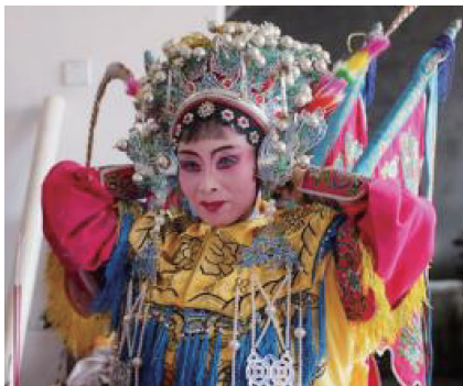
图5 八边形云肩实例