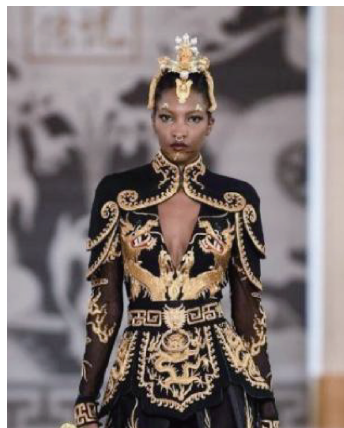
图16 盖娅传说品牌的服装

研究表明,云肩这一传统美学元素正被当代设计师以创新的方式重新诠释,人们在保留云肩传统精髓的同时,进行了以下创新:在设计理念上,将云肩的传统轮廓以现代审美视角重新解释,确保设计既实用、舒适又不失传统风采;在色彩运用方面,结合现代流行色趋势,使云肩更贴合当代人的审美喜好;在图案设计方面,巧妙结合传统图腾与现代图形艺术,创造