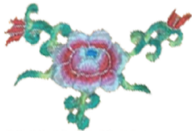
图 20 牡丹花吉祥图案

蕴。设计师将牡丹花图案在衬衣前扣处进行巧妙排列,布局有序而灵动,使服饰在视觉上呈现韵律美感,充分彰显精巧的设计构思。腰带上的印花条纹装饰,进一步丰富了整体图案的层次感,融入现代流行元素的质感,促使传统与现代风格和谐交融。