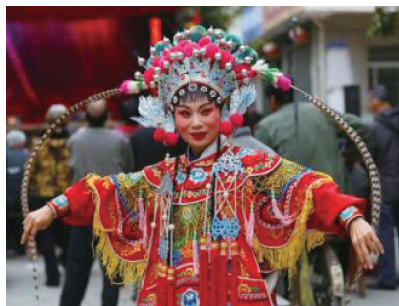
图6 波浪形云肩实例

莆仙戏服云肩的色彩及其搭配不仅是视觉美感的构成要素,更是角色身份、性格和内在情感的象征性表现。在中国古代,色彩的等级观念非常明确,可概括为正色、间色2个色区的划界,对应的是尊、卑2个阶层不同等级的社会地位。正色论最早源自南