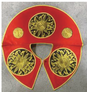
图 11 菊花图案

物图案应用较为广泛,常见的有牡丹、梅、兰、竹、菊及作为辅助图案的小花朵等 [5] 。如:图 11 所示云肩上的菊花图案象征高洁、高尚的品质;图 12 所示云肩上的牡丹图案则代表着富贵和繁荣,牡丹作为女性角色服饰中广泛使用的图案,能突显女性的柔美与尊贵。这些植物图案不仅美化了服饰,更在一定程度上暗示了角色的性格特征。动物图案以龙、凤、虎、鸳鸯、蝙蝠、飞禽等传统元素为主。武将的云肩常饰以龙(图 13)、虎等象征武勇与权威的图案,文官则多采用飞禽、凤(图 14)等图案,映射了“文禽武兽”的传统规制。这些动物图案通常以平面或浅浮雕的方式呈现,不仅赋予云肩丰富的民间情趣和动感美,还表达了人们对美好生活的向往和情感寄托。通过这些象征性的图案语言,在舞台上,云肩成为了传递角色身份、性格及理想愿望的重要媒介。