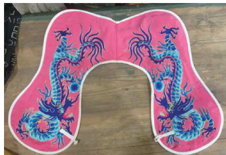
图 13 龙图案