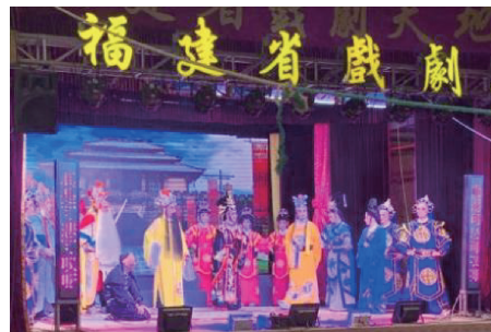
图3 莆仙戏的演出剧照

样,蕴含多种古典形式,有连缀一片式云版肩、一片式嵌肚肩、童肩、层叠式女靠肩、签牌肩、豆荚肩等类型。而在现代莆仙戏中,传统的云肩款式已逐渐被更为简约的设计所替代,大廓形、一体式的云肩已成为主流。其中,半圆形、八边形、波浪形、方形等形状以简洁线条勾勒、整体化造型呈现,契合大廓形、一体式设计,体现了简洁与时尚的融合。