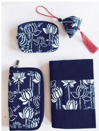
图4 纹样创新设计实例