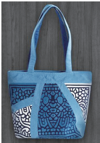
图 8 不同纹样镶拼创新设计的手提包

镶拼设计是近年来的一种潮流趋势,它是将各种零碎布料,按照设计效果要求,有组织地进行拼接、设计,设计的产品简单别致,表面具有特殊的外观效果。镶拼设计在齐鲁非遗蓝印花布旅游纪念品设计中得到了广泛应用,将不同风格、不同材质的面料与蓝印花布组合进行旅游纪念品的创新设计,能在齐鲁非遗蓝印花布旅游纪念品表面创造出奇特的视觉审美效果,提高齐鲁非遗蓝印花布旅游纪念品的时尚度,赋予其时代感,迎合现代人张扬个性、求奇求特的心理。图 8 所示不同纹样镶拼创新设计的手提包,十分受游客欢迎。