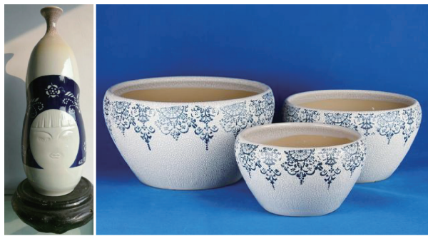
图 9 蓝印花布纹样在瓷器材料上的创新设计

具有一定的弹性,但透气性差,容易发霉。随着社会的进步,人们的审美需求也发生了一定的改变。为改变齐鲁非遗蓝印花布旅游纪念品材料单一的现象,可对材料进行优化,或将其与其他材料结合使用,将传统工艺与时尚潮流对接,进行创新设计,从而改变齐鲁非遗蓝印花布旅游纪念品材质单一的问题,丰富其种类。图 9 所示为将齐鲁非遗蓝印花布文化元素与瓷器融合设计的齐鲁非遗蓝印花布旅游纪念品,其质感独特,艺术语言丰富,美观实用,具有独特文化韵味,更符合当今游客的喜好。