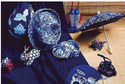
图1 充满艺术性的齐鲁非遗蓝印花布旅游纪念品 Fig. 1 Artistic tourist souvenirs of Qilu intangible cultural heritage blue calico

艺术性指人们在反映社会生活、表达思想情感时所体现的美好表现程度,常与文化性相结合,是旅游纪念品的精神属性。随着人们生活水平的提高,人们的审美情趣也不断提升,游客不仅关注旅游纪念品的实用性、美观性和品质,更关注旅游纪念品的艺术性、装饰性和观赏性。设计师设计时,应从游客的审美角度,设计富有艺术性的齐鲁非遗蓝印花布旅游纪念品,满足游客精神层面的需求,引发其消费行为。图1所示的齐鲁非遗蓝印花布旅游纪念品在审美和实用性基础上,通过造型、色彩、线条的创新设计,不仅能给游客带来审美愉悦,还可使他们获得精神上的享受。因此,能否合理把握艺术美学这一设计原则是对齐鲁非遗蓝印花布旅游纪念品设计的重要考量。