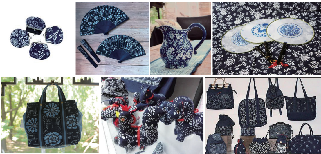
图2 丰富多样的齐鲁非遗蓝印花布旅游纪念品 Fig. 2 Diverse tourist souvenirs of Qilu intangible cultural heritage blue calico

齐鲁非遗蓝印花布旅游纪念品承载着游客对旅游地域的记忆,是其重温美好旅游经历的物象和载体,它体现了齐鲁地域的人文风貌,也体现了齐鲁地域的文化特色。设计齐鲁非遗蓝印花布旅游纪念品时,应将旅游纪念品的纪念性放在首位,充分考虑齐鲁非遗蓝印花布蕴含的民间文化艺术,融合艺术元素进行创新设计,在材料的选用和制作工艺上应突显齐鲁非遗蓝印花布的环保特色,只有这样,才能设计出既具现代感,又具传统历史文化特色的旅游纪念品。