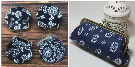
图5 款式创新设计实例

图5所示的齐鲁非遗蓝印花布旅游纪念品钱包,不仅表面巧妙地运用了不同的蓝印花布纹样,其款式也很别致,体现了地方特色,满足了游客的视觉审美需要和心理需求,产品性价比较高。