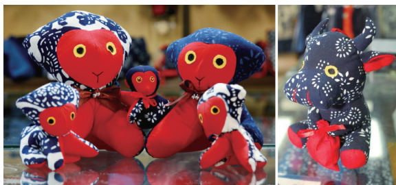
图6 色彩创新设计实例

与现代相结合的颇具艺术美感的旅游纪念品。然而在齐鲁非遗蓝印花布旅游纪念品色彩突破与创新的同时,也不能丢失齐鲁非遗蓝印花布的灵魂。齐鲁非遗蓝印花布旅游纪念品色彩的创新,目的是将传统的、民族的艺术瑰宝与现代的、流行的艺术设计相融合,让更多人了解齐鲁非遗蓝印花布,并加以保护与传承。如图6所示,在单调、素雅的蓝印花布基础上,运用三原色纯度的变化原理,在动物玩具脸部搭配了一些醒目的红色、黄色图案,红色、黄色与布料本身的蓝色产生了相得益彰的视觉效果,且这些玩具款型时尚新颖,图案形态饱满,更好地展现了动物玩具的活力与个性,体现了当代的审美理念。