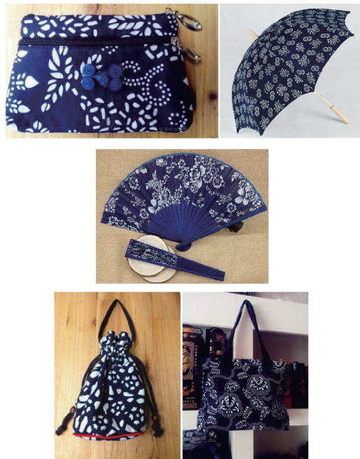
图3 兼具实用性的齐鲁非遗蓝印花布旅游纪念品 Fig. 3 Practical tourist souvenirs of Qilu intangible cultural heritage blue calico

则,本文从纹样、款式、色彩、包装、镶拼、材料6个方面探讨齐鲁非遗蓝印花布旅游纪念品的创新设计。