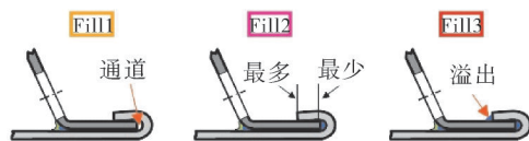
图 1 装焊胶填充要求

装焊折边的装焊胶填充要求分为 fill1、fill2、fill3 三种(见图 1)。机盖的装焊胶填充要求为 fill2。