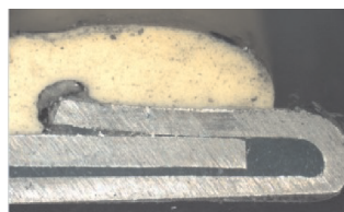
图 2 装焊板材翘起

观察剔试胶泡切角的截面图,并且联合装焊车间工程师,发现折边有以下问题:1)板材翘起,未完全压实折边(图 2);2)装焊胶填充不实(图 3)。